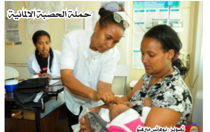
حملة الحصبة الألمانية

مفهوم التغطية الصحية العامة ليس امر جديد في ارتريا، يركز بشكل اساسي على الرعاية الصحية الاساسية، فمنذ فجر الحرية بتاريخ 13 نوفمبر للعام 1991م اصدرت جريدة حداس ارترا في عددها رقم 22 للعام الاول، السياسة الوطنية الصحية الاولى، والتي ركزت بشكل اساسي على العدالة الاجتماعية، وقد صدر الميثاق الوطني في فبراير 1994م والذي يتسق مع ميثاق الجبهة الشعبية، وهذا المفهوم ظل يستخدم منذ فترة الكفاح المسلح، وكانت تلك السياسة الصحية الارترية للعام 1991م تعتمد على الانتشار الواسع والمتوازن للخدمات واتاحة الفرص والاعتماد الذاتي، ومشاركة الشعب النشطة، ومشاركة مختلف الجهات، والتي تطورت منذ فترة الكفاح المسلح، وتميزت بالعدالة الاجتماعية، ومبادئ الجبهة الشعبية، وهذه التغطية الصحية العامة تنطلق من الانتشار الواسع والمتوازن للفرص، لتصبح من اهم المفاهيم للرعاية الصحية، والركيزة الرئيسية للسياسة الصحية التي تأسست بالعام 1991م، فالجبهة الشعبية بدأت الرعاية الصحية الاساسية قبل اعلان المرسوم على مستوى العالم عام 1978م عبر الاطباء المتجولين، وغيرهم من العاملين في مجال الصحة والذي كان في البداية في مدينة المانأ بروسيا الاتحادية، واصبحت حالياً المانيني بكازاخستان، حيث قاموا بتقويته اكثر في تلك الفترة، لذا يمكن القول بأن التغطية الصحية العامة في ارتريا بدأت قبل 50 عاماً، وظلت تطبقه بشكل فعلي، وركزت بشكل كبير على اوصول الخدمات وانتشارها بشكل متوازن، ليصبح اوسع واعمق، وبعدها وضعت اهداف الخطط التنموية للعام 2016م، اصبح مفهوم تغطية الصحة العامة يتضمن 3 جوانب رئيسية، الجانب الاول، ركز على