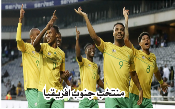
منتخب جنوب أفريقيا