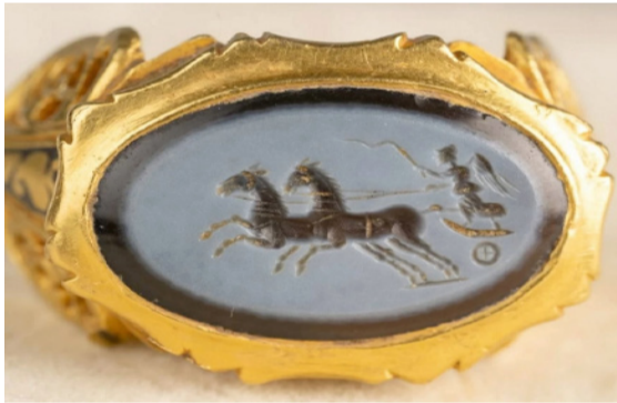
ومن المقرر عرض الخاتم في جولات تعليمية قبل نقله بشكل دائم إلى متحف سومرست في مدينة تونتون