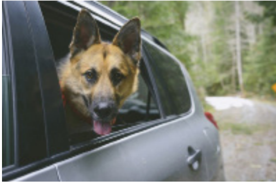
2023 حثفه برصاص بندقية أطلقها كلب بالخطأ خلال رحلة صيد.

تنظيفها، وقد تطلب الأمر إجراء عملية جراحية لكنه نجا. وفي مارس 2025، أصيب رجل في تينيسي بخدش في فخذ الأيسر عندما قفز كلبه على السرير وعلقت قدمه في واقي الزناد. كما لقي رجل في كانساس عام