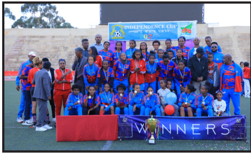
السيدات، مؤكداً حضوره القوي في المنافسات المحلية.