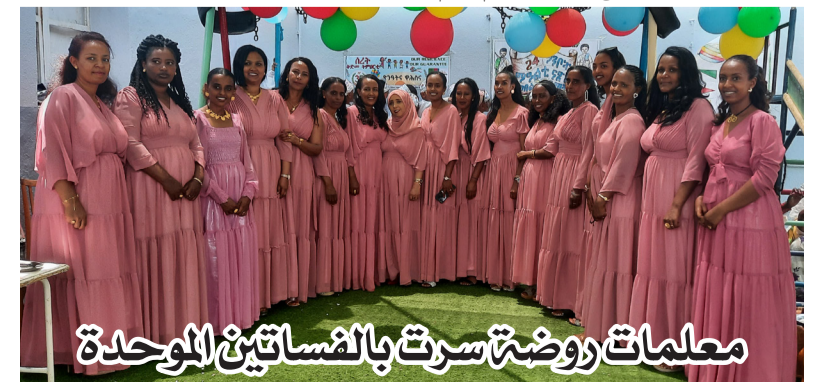
معلمات روضة سرت بالفساتين الموحدة