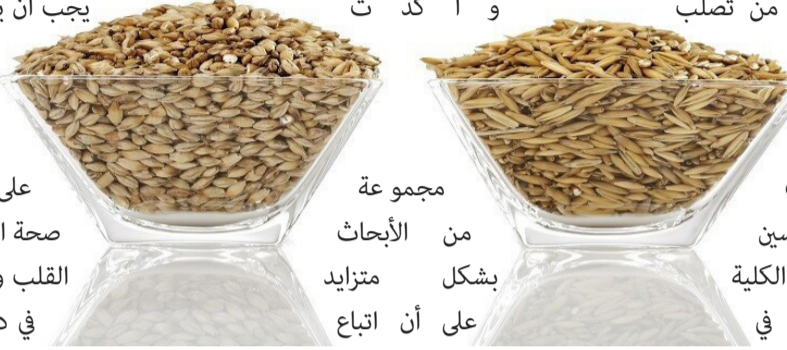
مجموعة من الأبحاث بشكل متزايد على أن اتباع نظام غذائي

في دراسة شاملة أجراها عدد من الباحثون، وجدوا العلاقة بين تناول الألياف الغذائية ومعدلات الوفيات الناجمة عن أمراض القلب التاجية. وأشارت نتائجهم إلى أن تناول الألياف القابلة للذوبان وغير القابلة للذوبان يرتبط بانخفاض كبير في خطر الوفاة المرتبطة بهذه الحالة. والجدير