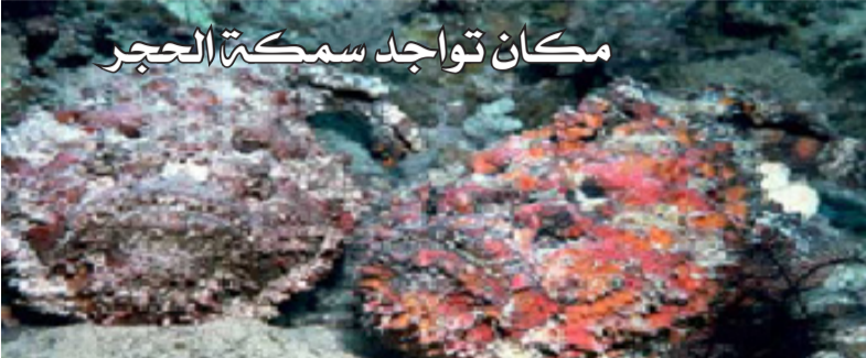
مكان تواجد سمكة الحجر