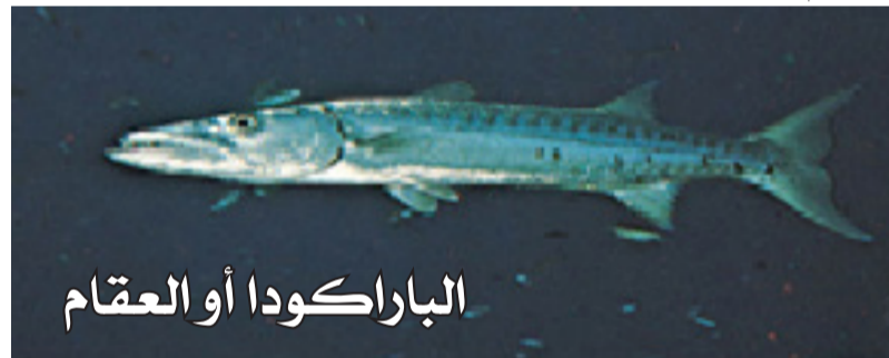
الباراكودا أو العقام

5- ثعبان البحر:- ثعبان البحر الموراي سمكة تعيش في المياه الاستوائية، وتحديداً في البرك والثقوب الموجودة في الأعشاب البحرية الميتة. يُعرف ثعبان البحر بنزغته الدفاعية الشديدة عن منطقتها، وغالبًا ما يُصيب السباحين بالقرب من ثقوبه وبركه. ورغم أن عضته قوية ومؤلمة، إلا أنه يصعب تمييز مكان العضة بعد حدوثها. ثعبان البحر سمكة انفرادية تراقب ما يدور حولها بدقة.