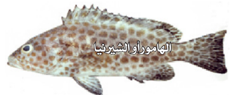
الهامور أو الشيرنيا

السمكة مؤلمة للغاية وقد يُسبب غثياً وقيئاً وتعرقاً وصعوبة في التنفس. قد تؤدي بعض الحوادث إلى الوفاة.