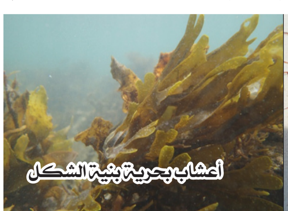
أعشاب بحرية بيضاء الشكل

تقنية النانو أن مستخلصات الأعشاب البحرية تُعالج بالأدوية لتُستخدم كنظم لإيصالها. تتميز هذه الطريقة بالعديد من المزايا مقارنةً بالعلاجات الطبية السابقة إذ تُساعد الدواء على الوصول إلى الجزء المصاب من الجسم لإتمام عملية الهضم والتكامل في الجسم ويمكنها علاج أمراض مختلفة مثل السل والسكري وأمراض القلب وسرطان الثدي وغيرها دون أي آثار جانبية جانبية.