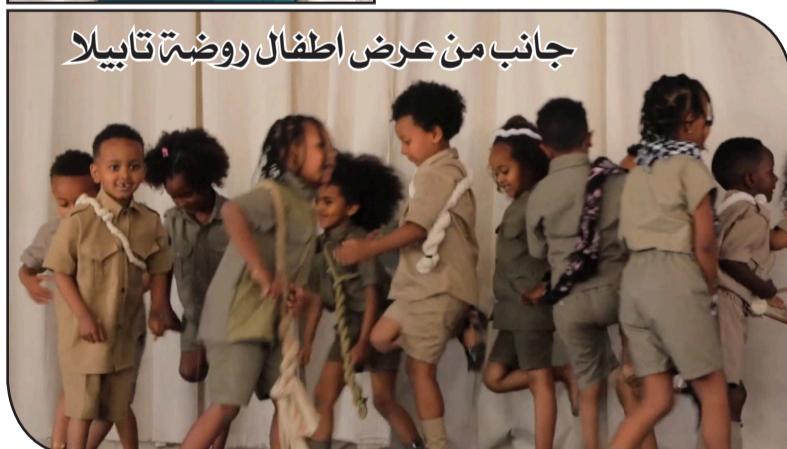
جانب من عرض اطفال روضة تاييلا

قد جرت قبل إسبوعان على مستوى البلد ، والهدف من هذه الفعالية هي ان البلاد تطمح بأن تخرج من صلب اطفالها رياضيين باهرين"، وأضافت " شاركت روضتنا في تلك المناسبات واستطيع ان اقول ان أداء تلامذتنا كان ممتازاً، كما كان اداءهم اليوم ايضاً جميلاً جداً"، واختتمت حديثها بتهنئة الشعب الإرتري وقوات الدفاع بهذه المناسبة.