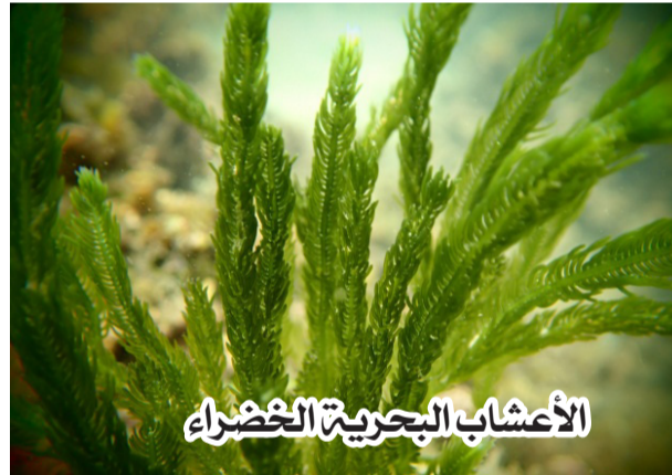
الأعشاب البحرية الخضراء

2- الأعشاب البحرية كدواء: أثبت علماء الأحياء أن الأعشاب البحرية مفيدة في علاج العديد من الأمراض مثل الالتهابات ولفطريات والسرطان وغيرها. وقد أظهرت الأبحاث الحديثة في مجال التقنية الحيوية، وتحديدًا