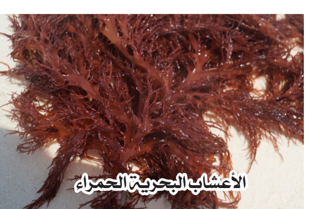
الأعشاب البحرية الحمراء

باستخدام الأعشاب البحرية: سداد الأعشاب البحرية السائل، وصابون الأعشاب البحرية، وتلعب هذه المنتجات الطبيعية دورًا هامًا في الزراعة والتجارة والصحة.