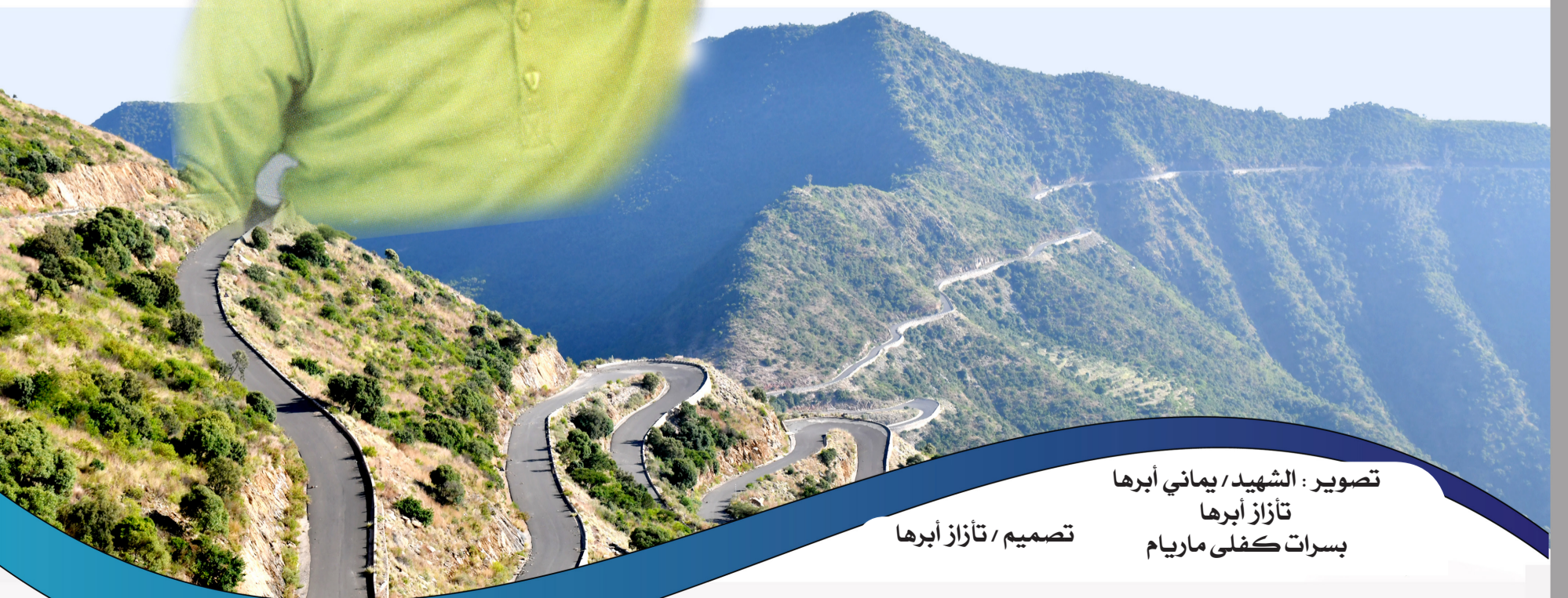
تصميم / تازاز أبرها