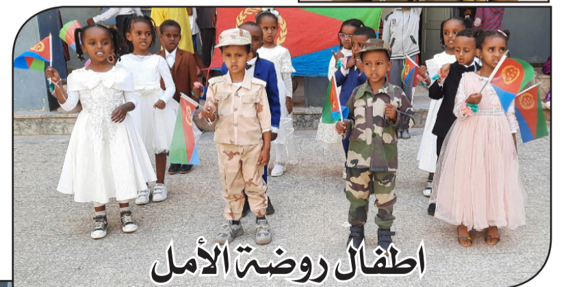
اطفال روضة الأمل

الموكلات بالاطفال وجهودهن الجديرة بالتقدير لما خرج هذا البرنامج بهذا الشكل الرائع والذي نال استحسان الكل، لذلك اتوجه بشكري لجميع معلمات روضة تاييلا وأشكر جميع الأمهات على إهتمامهن بملابس الأطفال وتصفيق شعر الفتيات لكي يخرجن في افضل صورة