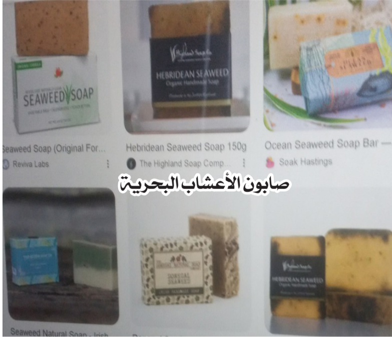
صابون الأعشاب البحرية

ترجمة/محمود إدريس سليم إعداد / مسقنا قيتووم