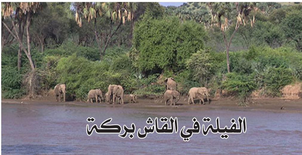
الفيلة في القاش بركت

في حالتنا، تُعد الأفيال في أوقارو وقونيا وهيكتا وما حولها، والحياة البرية المحيطة بأمحجر، وغيرها من