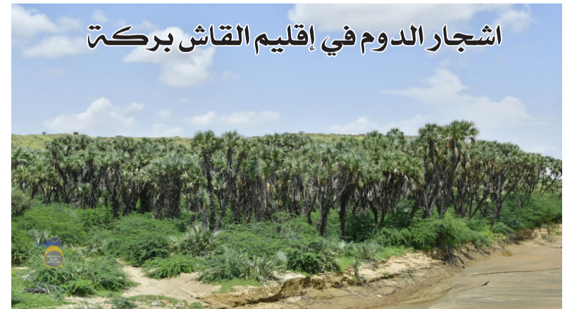
اشجار الدوم في إقليم القاش بركت

اعتماداً كبيراً على هذين النهرين كما تنتشر أشجار النخيل على ضفاف هذين النهرين. بينما يسهل العثور على أشجار النخيل في إقليم القاش بركة، على النقيض من ذلك، يصعب العثور على الأفيال حيث يتطلب الأمر جهداً كبيراً ومشياً لمسافات طويلة للعثور عليها، إن حالف الحظ وهو ما يجعل من هذه الرحلة، رحلة مميزة وذات قيمة. تتكون إرتريا من تسع قوميات: التقرى، والتقرينية، والساهو، والعفر، والكوناما، والنارا، والبليين، والباداويت، والرشادة ومعظم هذه القوميات التسع تتواجد في إقليم القاش بركة ولهذا السبب، يتميز الإقليم بتنوع ثقافي وعادات وتقاليده غنية فكل ما هو موجود في البلاد تقريباً موجود في هذا الإقليم حيث يمكن الزائر للإقليم أن يدعي معرفة كل شيء عن إرتريا من