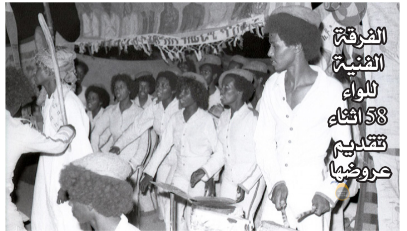
الفرقة الفنية للواء 58 أثناء تقديم عروضها