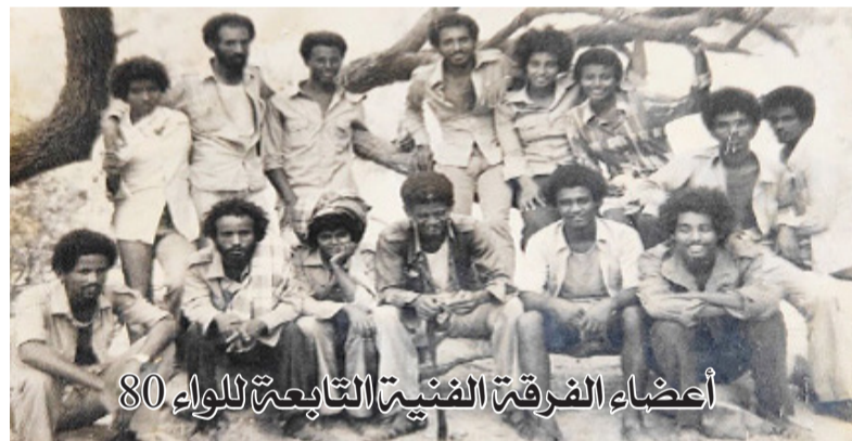
أعضاء الفرقة الفنية التابعة للواء 80

وكان فترة الانتصارات هذه هي الفترة التي تم فيها إعادة هيكلة للجيش الشعبي الذي كان قائم على مستوى الألوية، وتم ترقيته إلى فرق عسكرية،