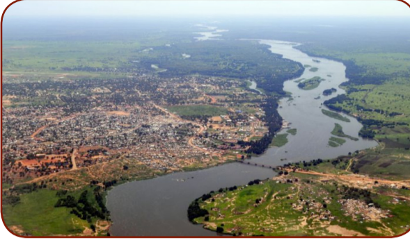
في القارة السمراء وثاني أكبر بحيرة للمياه العذبة في العالم، وتقع في

قلب إفريقيا الاستوائية وتُشكل المنبع الرئيسي لنهر النيل (النيل الأبيض). وتتوزع مياه البحيرة بين ثلاث دول رئيسية في شرق إفريقيا، هي: تنزانيا وأوغندا صاحبتا النصب الأكبر من مساحتها، إلى جانب كينيا.