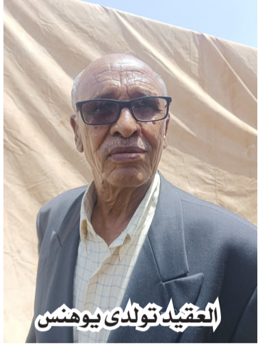
العقيد تولدي يوهانس

الضيوف، ومن المعلوم ان الهدف من هذه السرادق هو صبغ الاحتفال بذكرى الاستقلال بالطابع الشعبي لان الثورة بدأت من الشعب والى الشعب اي انجزت الاستقلال للشعب، والشئ الثاني ان هذه السرادق تتيح الفرصة لالتقاء الاجيال والمواطنين من قوميات مختلفة ومن ثم تبادل الخبرات والتجارب فيما بينهم ونقل القيم الثورية التي انجزت الاستقلال الى الشباب بصورة عملية عبر اقامة السرادق الشعبية وتقديم الولايم فيها وكذا البرامج الثقافية من اغاني ثورية وقصائد ومسرح وغيرها.