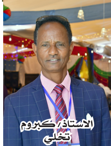
الاستاذ/ كبروم تخلي

طويل توج بالنصر، اليوم الذي تغلو فيه الرقاب وتردد بإسم الحرية ولنمضي معا نحو مستقبل أبعد وأكثر إشراقاً من أي وقت مضى. كل عام وأنتم بخير !!!