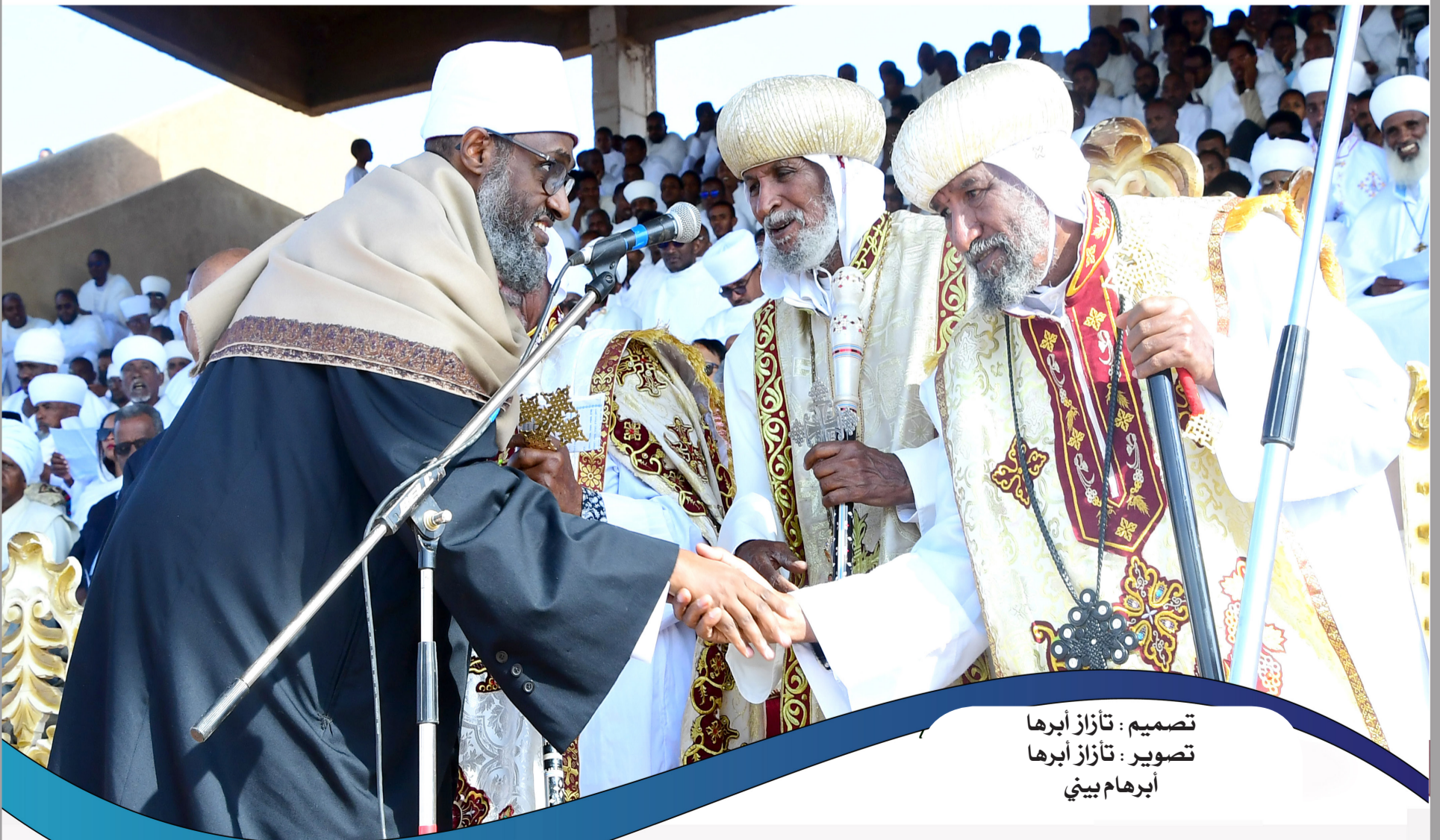
تصميم : تازاز أبرها تصوير : تازاز أبرها أبرهام بيبي