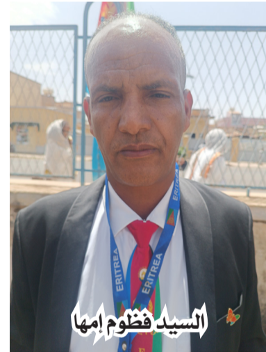
السيد فظوم امها

اكمل وجه لكونها نتاج تاريخنا النضالي كما ذكرت سلفا، وبكل صراحة الشعب الإرتري شعب قوي