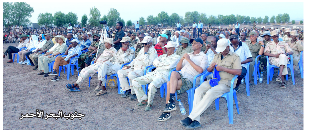
جنوب البحر الأحمر

وتضمن البرنامج تقديم روايات وشهادات حية حول البطولات التي سُجلت خلال مراحل الكفاح التحرري، ولا سيما ما ارتبط بالانسحاب الاستراتيجي، حيث استعرض عدد من المشاركين