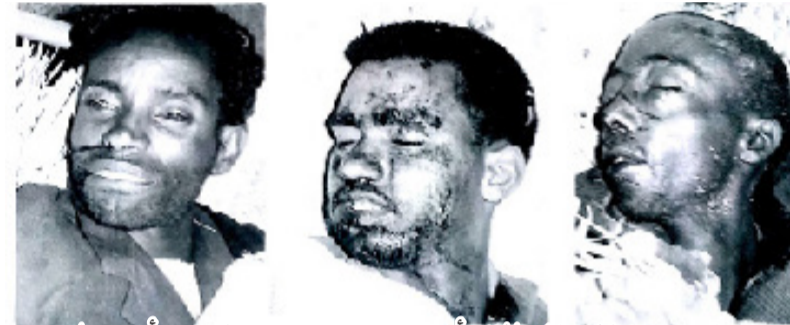
جانب من المجازر التي أرتكبت في ضواحي أسمرا