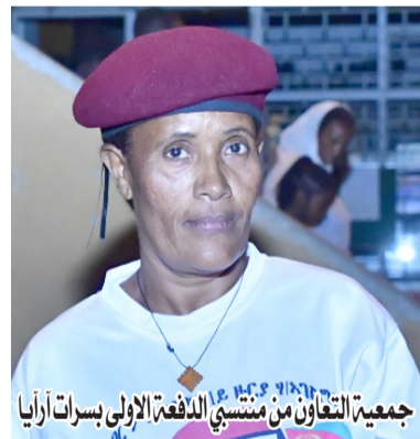
جمعية التعاون من منتسبي الدفعة الأولى بسرات أريانيا

والامن بالإقليم الاوسط كذلك الثقافة والرياضة بالإقليم الاوسط وقوات الدفاع ومؤسسة الكهرباء ووزارة الاعلام بجميع أقسامها.