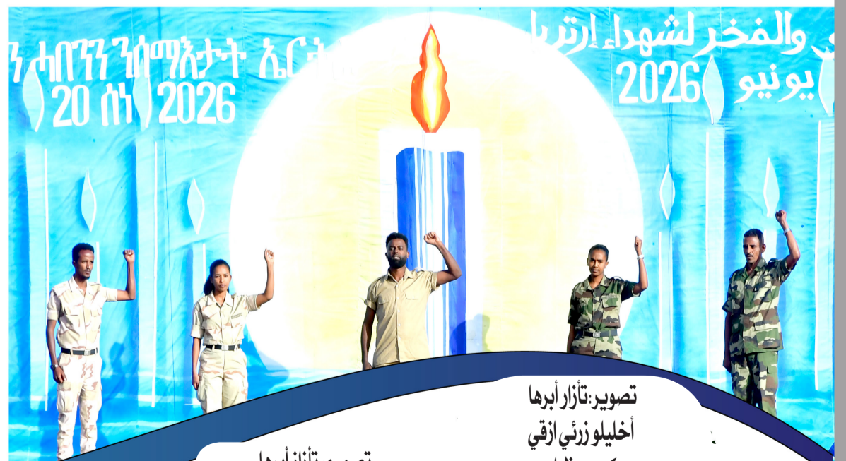
تصميم: تازاز أبرها