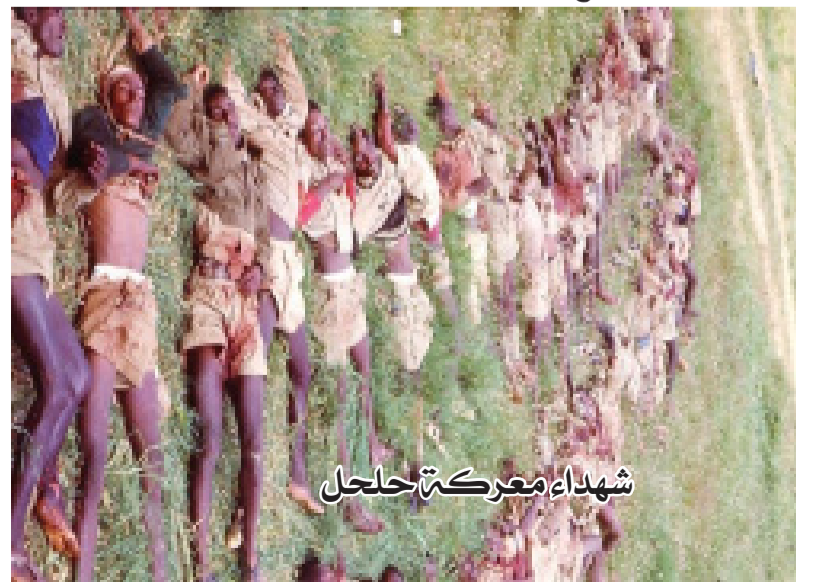
شهداء معركة حجل

والتنكيل به. في صباح يوم الخميس الموافق الثامن عشر من يونيو الجاري إنطلقت مسيرة حاشدة من اعضاء الشرطة الإرترية وقادتهم من المكتب المركزي للشرطة الإرترية في العاصمة أسمرا في مشهد مهيب إحياءاً لذكرى الشهداء، وصولاً إلى شارع الحرية موقع المعرض الذي نصب جوار مكتب إدارة الإقليم الاوسط. وبعد وصول المسيرة الحاشدة إفتتح مسؤول الأمن