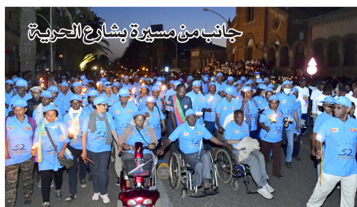
جانب من مسيرة بشارع الحرية

إن الشهيد كما نعلم هو مجد الوطن وحيته فلولا الشهداء لما كنا نعيش الآن بحرية وسلام وأمان، فبتضحياتهم حموا الأوطان، والشهداء هم خير الامة في المجتمعات جميعها، نحتفل بذكراهم مطلع كل يوم ومع كل شروق شمس نحياه فلندعو لأرواحهم بالرحمة والخلود.