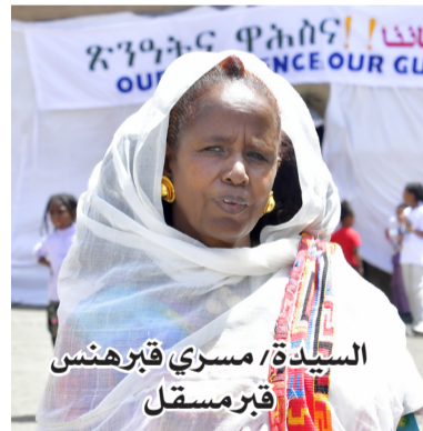
السيدة / مسري قبرهنس قبرمسقل

تخلي، حيث عبر عن شعوره بهذه المناسبة المجيدة قائلا، أنا سعيد جدا بمشاركتي بعيد الاستقلال الخامس والثلاثين لهذا العام، مضيفا بذلك بأن مغزى شعار هذا العام "صمودنا ضماننا"، وأن صمود الشعب الارتري ليس وليد اللحظة بل امتداد لصموده لكافة المؤامرات والعدائيات التي تحاك ضده، ويتميز هذا العام عن الاعوام الماضية بهذا الشعار الفاضل، الذي يحوى صموده وتحديه لكل الصعاب ويعود الفضل في ذلك توجيهات القيادة