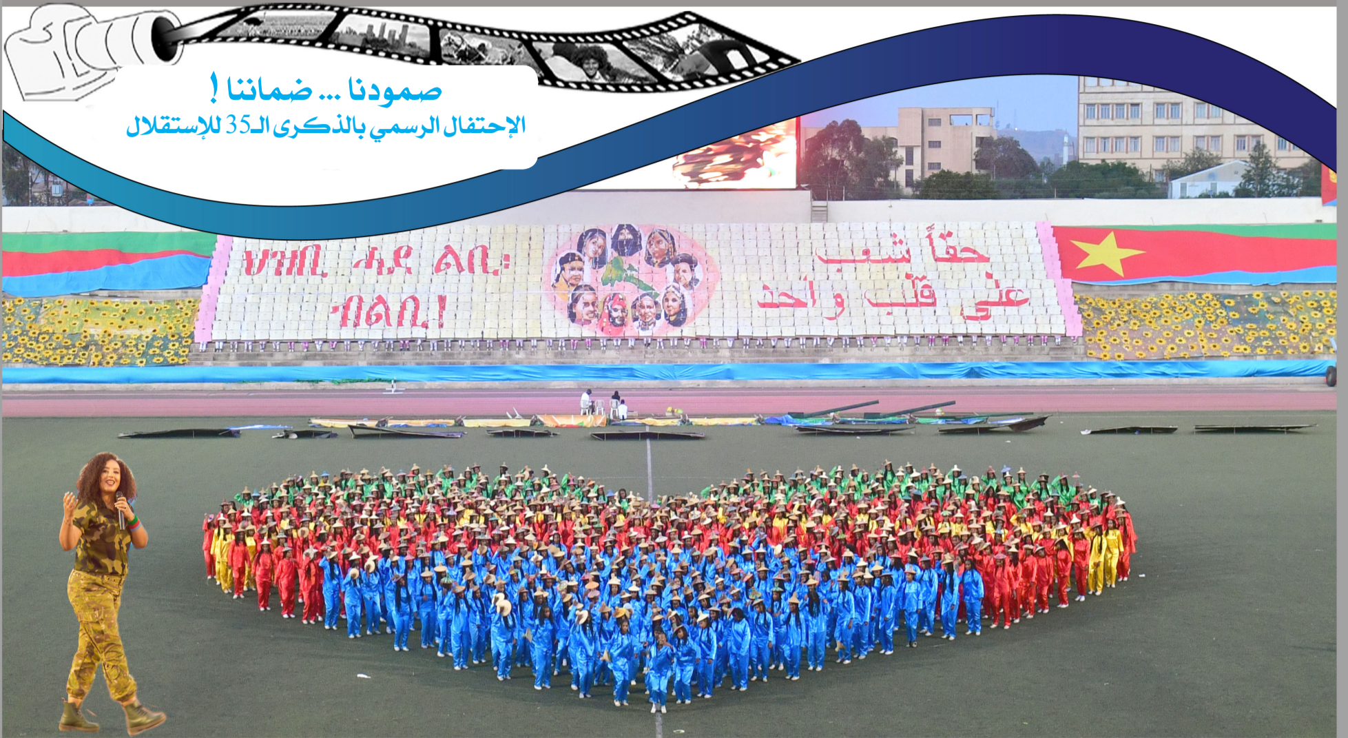
صمودنا ... ضماننا! الإحتفال الرسمي بالذكرى الـ35 للإستقلال