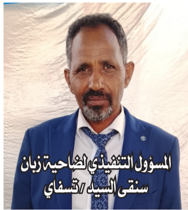
المسؤول التنفيذي للضاحية زيان سنقي السيد / قسفاي

وكل العاملين بمديرية قزا باندا بعيد استقلالنا المجيد.