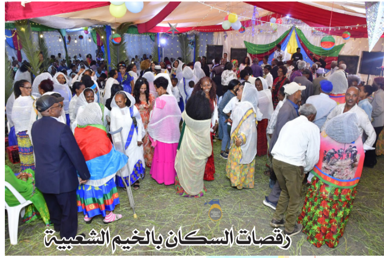
رقصات السكان بالخيم الشعبية

اللازمة من مآدب الغداء وتقديم مختلف المشروبات، ليسعد بها شعبنا بتناول الوجبات معاً، والاستماع لمختلف الاغنيات الوطنية، والرقص معاً، وتقديم كافة البرامج من المسرحيات والاناشيد من قبل الاطفال، والقصائد المختلفة، حيث يفرح كافة السكان ويشتاقون الى هذه المناسبة، وفي فترة النضال قاتلنا حتى دخلنا مع رفاقنا الى مدينة عصب، وانهينا المهام والمعارك في دنكاليا، وكان سكان عصب حينها قليلين، وكانوا يحملون بقدم الحرية بشكل كبير، وقد استقبلونا بكل شرف وكرامه، حيث اجرت كل الاسر الاعياد بشكل فريد ومتميز، وعندما نلاحظ الى كل العقبات التي اجتازناها، نجدها صعبة رغم ذلك تخطاها الشعب بكل عزيمة وصمود، وبفضلنا بلغنا الى هذا المستوى المرموق، واصبح لدينا ضمان مبنى على الاسس المتينة والصلبة، اشكر كافة الشعب والمقاتلين، ولكل شبابنا الذين يتحملون المسؤولية على عاتقهم، واهنئ قوات الدفاع الباسلة بهذه المناسبة الخالدة واتمنى لكم التوفيق والسداد.“