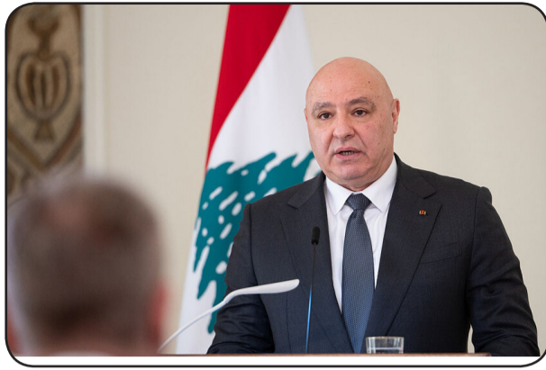
الجنوب واجب تحمله الدولة بدعم من أبنائها، لأنه خيار لا بديل عنه.