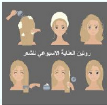
روتين العناية الأسبوعي للشعر

خطوات الروتين الأسبوعي للعناية بالشعر 1. تقشير فروة الرأس (مرة كل أسبوعين) الفائدة: إزالة خلايا الجلد الميتة، وتراكمات منتجات التصفيف، وتحفيز الدورة الدموية.