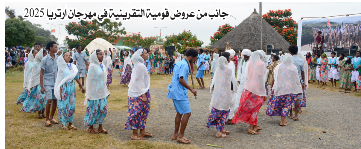
جانب من عروض قومية التقرينية في مهرجان ارتريا 2025

تنظمها إستعداداً للموسم الزراعي، حيث تتجمع نساء القرية ويغنين مختلف الاغاني والترايم متفائلات بموسم أمطار خير وغني بوفرة المحاصيل. وإذا ما تاخرت الأمطار يبتهلن ويدين ويغنين مختلف الهازيج الشعبية ويظن على الاراضي الزراعية حاملات في ايديهن