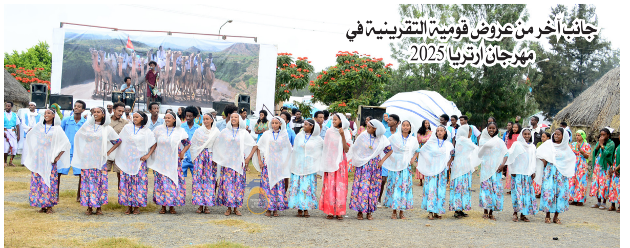
جانب آخر من عروض قومية التقرينية في مهرجان ارتريا 2025

الالحن التراثية والأهازيج الشعبية التي تكون بمثابة التوسل لربه لينزل عليه رحمته وبركته لتهطل الأمطار، ويستمر طوال اليوم بلا كلل او ملل في حرث أرضه، فيغني تارةً ويحث ثوريه بكلمات على المواصلة في الحرث، والشمس ساطعة في كبد السماء، وفي نهاية اليوم تهطل الأمطار فيعود ذلك المزارع الذي كان يعمل