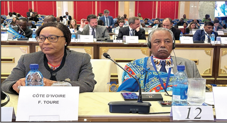
ተሀየቡ፡ መሻርከት እንዴ ወሰከው፡ ተቃሪር ካትብ ዓም ሐቀለ ሰምዐው፡ ዲብላ

ተሌ እጅትማዕ ቤት ጎማት ውዘራእ ናይ ሕበር በርላማን መንጠቀት አፍሪቀ ወእተሐድ አርብ ዲብላ ልትቀደም ይማም ሐቀለ ሀድገው አራእ ቀደመው። ልኡክ ኤረትሮፕ ዲብላ ቀደመዩ ረአይ፡ ምስል እተሐድ አርብ ዲብ ገብእ እጅትማዓት፡ ቅየም ድወል አፍሪቀ እግል ልትሐለፍ ክም ኢወጅብ ወእህትማም እግል ልርከብ ክም ለአሰትህል ሐበረ። እሊ ክእን ዲብ እንቲ፡ መሻርከት እብ ክሰብ ዶር ናይ መንጠቀት ተናዘም ወበርላማናት ሰላም ወአምን አፍሪቀ እግል ልትአከድ ናቀሸው።