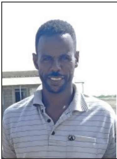
አሸቃል እብ አተላላይ እንሸቁ።

እሊ ሌጠ ኢኮን ሓለት ሽባብ ወድዋራቶም እትሚ ክም ህሌት መታብዐት ትርድት እንወዴ እግልሚ ሕለት ወደቅብ ናይ ወጠን ወምጅተመዕ ዲብ መሸንገል ሽባብ ሰበት ገአት፡ ሽባብ ምስል ድዋራቶም ወሓድረት ሓለት ዐዶም እግል ለአምር እበ ልብል አርእሰ ድራሳት ህሉ፡ ዲብ መዳነትነ ለገብእ ነሽጣት ክም ሽቱል ዕጩይ እሊ አገረሞት መዳነት ለልብል ወቀይ ህለ