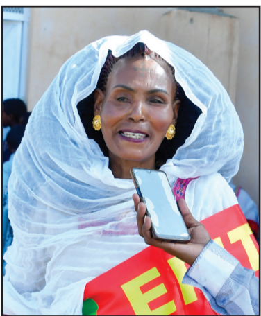
ሙናድለት ማና ሓድጉ ማይዐይኒ ገዳይፍ