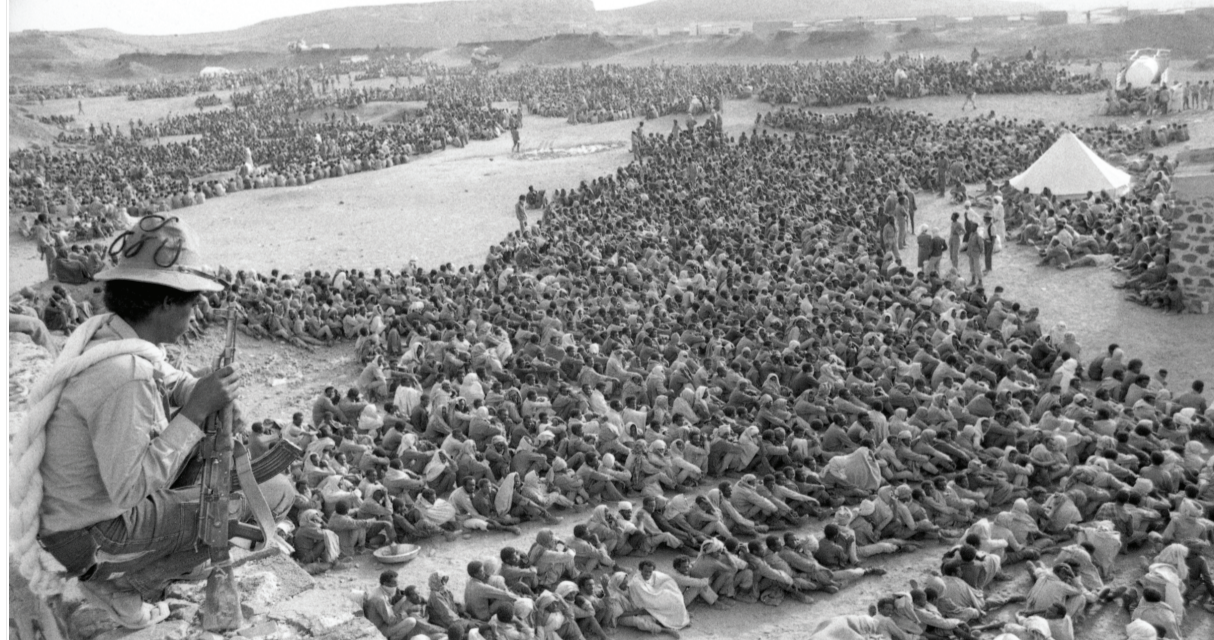
ለአግዱ ወቅት እንዴ ኢነሰእ እግል ፋይሕ መግርክ ዲብ

መዳሊት ትጸመደ። መከናይዝድ ብርጌድ 23 እብ ምር ቦጦሎኒ ደባባት፡ ቦጦሎኒ መድፈዕ፡ ቦጦሎኒ ረሻሽ ክምሰልሁመ ምዳድ ደባብ ወዋያራት ሚሳይል ለጸብጠዩ ውሕዳት ለትከወነት ዐለት። እለ ውሕዳት እለ ምዳድ-ዋያራት ሚሳይል ለጸብጠዩ ውሕዳት ለትከወነት ዐለት። እለ ውሕዳት እለ ዲብ ከጥ ወልድዮ-ደብረታቦር ዲብሊ ህሌት ሸብህ መዳነት ገርገረ፡ እግል ምር ወሬሕ ሰለሕ በህለት ደባባት፡ መዳፊዕ ወረሻሻት እግል አዳለዮት እምበል ዕርፍ ዲብ