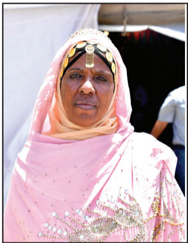
ሙናድለት ፋጥነ ሰዓዳይ መዐስከር አልጌን