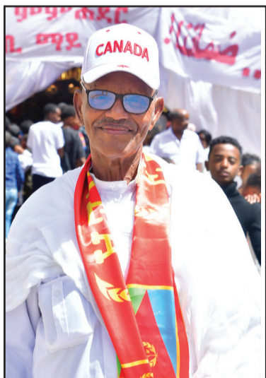
አሰይደ ተወልደ ሰመረኣብ ማይወላኹ

ሕርየት እት ልትሃጌ ህይ ክእኒ ልብል፡ “ዲብ ታሪክ ኤረትርየን 24 ማዮ ዐቢ ወልትሳነኩ ለአለቡ ዓድናቱ። ሰበት እለ ክልን ዓሊሳት፡ ዋልዲን፡ እማን ምስል ወላድን ዲብ እለ እሕትፋል እብ ለትወቀለት እንሻርክ ህሌ። እለ ለልሓልፋ ርሳለት፡ ሕነ ኤረትርየን እግል ሕርየት ለደፍዐናሁ ቃሊ ዐውል እሰትሸሃድ፡ ምስክነ፡ ጅራሕ፡ ተዐብ፡ ሰጅን ወመአሲ እክል አይ ክቡድ ክምቱ እለ ዲብ እንፈቅድ ሰበት ነይዱ እብ አማን ርሳለቱ ቀላል ኢተን። ምስል ወላድን ህይ ዲብ እለ እብ ሕብር እንውዕል እት ህሌን ዐባይ ርሳለት ለሓልፍ። ታሪክ ናይ ኤረትርየ ታሪክ ናይ አትወራረሶት ሰበትቱ ወላድን ኩሉ ቢያን እብ ዐመል ክም ለአሙሩቱ ገብእ ለህለ። እግልሚ እለ ዳሰነ ንዳል ወቅየሙ እበ ለልአትሐላልፍቱ ገብእ ለህለ። ምን ሰነት ዲብ ሰነት ህይ ዲብ ልትሻር ገይሰ ለህለ ዓድ ሸዐብ ኤረትርየቱ። ሕነ ህይ ክም ሸዐብ ዲብ እለ ሐሳሲት መንጠቀት