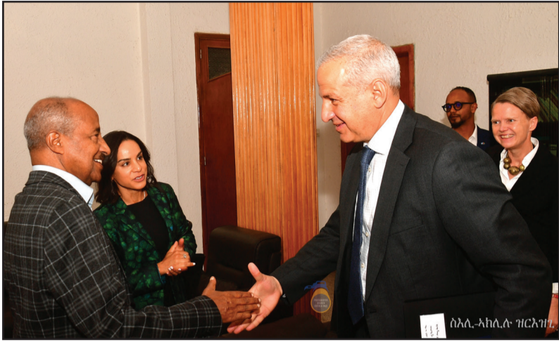
ወሰቀት ወተሰጃል ርዙቅ ተኔሪካይ ወረቁቅ ውርስ ኤረትሮፕ፡ ክምስልሁ-መ መባደሰት ተጃርብ ዕለ-ም ዲጂታይ ወወቅል በሰር/ሰናዕት ዲብ ተዕለ-ም ወሐብሬ ለረከዘ ሀድግ ወደ። ለመመቅርሐይት መአሰሳት

ልኡክ መዝመት ተዕለም፡ ዕለም ወግዳት መዝመት ምጅልስ ቅራን - 'የኔሰኮ' የም 28 ማዮ ምስል ውቁላም ሰብ-መዝ ሕክ-መት ኤረትሮፕ፡ ዲብ መትሰዳዳይ-ሕድ ወአህምየት ሕበር ለሶም ቅደይ ሀድገ።