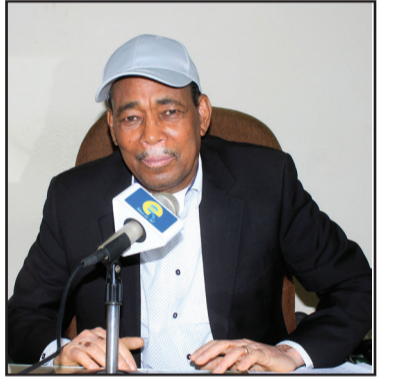
ሰዳይት ክም ገብእ ኣብርሀ።

እምበል እሊ፡ ዓይላት ሹህዳኔ እብ እቅትሳድ ርሐን እግል ልቅደረ ሕፍዝ ክም ገብእ እንዴ ሐበረ፡ እብ 2.5 ሚልዮን ነቅፈ፡ 257 ዓይለት እብ እንሱሰ ወተጃረት ክም ለሐድረ ጋብእ ክም ህለ ሸርሐ። ህቱ እንዴ ኣትሉ፡ ራዐዮት ዓይላት ሹህዳኔ መስኪልዮት ኩሉ መጅተማዕ ክምቱ ሐቆለ ሐበረ፡ እብ ደረጃት መጅተማዕ ዲብ ወራታት ሐርሱ፡ ዐጨድ ኣትሳናይ ኣብያት ወብዕድ