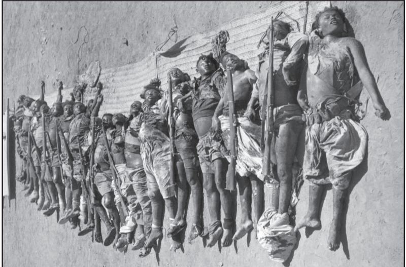
ዲብ ሐርብ ለአሰተሽህደው ላኪን አባይ ሽዑብ ጀላብ እግል ለርዕብ እሎም ዲብ መዳነት ከረን ዲብ ዐዳገ ለሳቀለዮም ፍሩሶ 1965

ዲብ ደንገብ ዲብ ሰነት 1975 ዲብ አሰመረ ዲብ ከረ ዲብ ከረ ገጀረት፡ ባር አማንኤል፡ ወብዕድ አካናት ዲብ ረአስ ሽዑብ አሰመረ ለጀረ ጀራይም እስትዕማር ክሉ ለህይ ከምን ለህይ ለልትመክረህተ። እት ዘበን አቶብዩ እት ረአስ ሽዑብ ኤረትርዮ ሚ ወሚ ኢጀረ። ክሉ ለህይ ከምን ለህይ ለልትመክረክ አክይ መዋዲት ርኡይ ወሰጥዕ ተ።