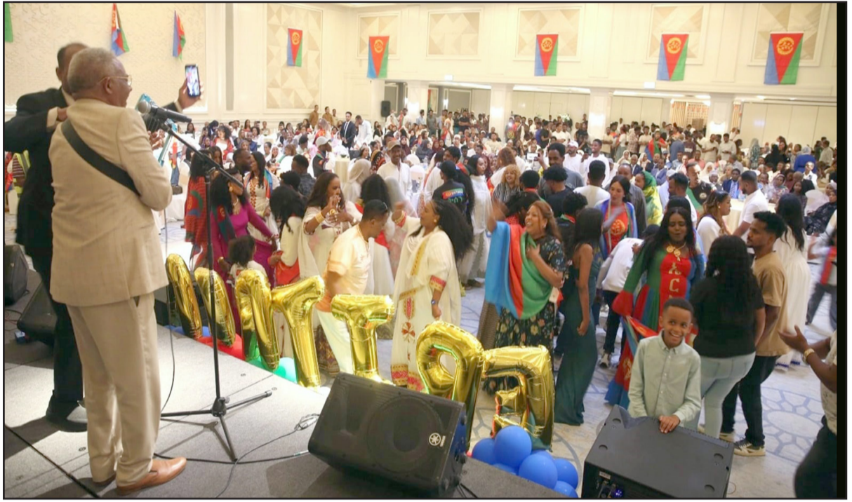
እናሕደሰናን ከምዝኸነ ብምጥቃቕ ከም ወገኑ ብልዑል ንቕሓትን ሓይል ውዳሰን ምሕራሕ ከምዘድሊ ኣገዛዚ።