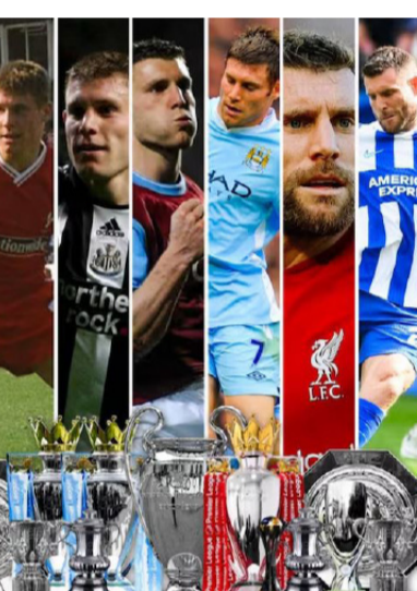
ዝኣብን ኣመገቢን ስታዲየም ወዲ 16 ዓመትን 356 መጻልታትን ከምሓውን ወዲ 39 ዓመትን 239 መጻልታት ኣገዛሎ ስታዲየም ሰማእታት።

ጎሳ፡ ክሰብ ምዘዘዘ ወቅቲ ኣብ 658 ግምት ፕሪሚየር ሊግ ብምጽዋቱ “ናይ ከሉ ማይ ተሰላፊ” ብምዃን ክብረ ወሰነ ሓቲ እዩ ጫማኡ ሰቂኩ ዘለ። ኣብ ታሪኽ ፕሪሚየር ሊግ ካልኢ ዝጸበን