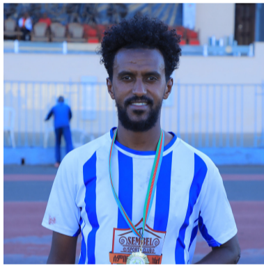
ዞባ ሊግ ሰምበልን

ማይ ተመናይን ኣብ ዞባ ማእከል ንክልተ ዓመት ዝሰገሎት ብሉጻት ተጸውተ፡ ማእከል ታላብንን ኣብ ሞሞሪ ሰማእታት ተራኽብኦ።