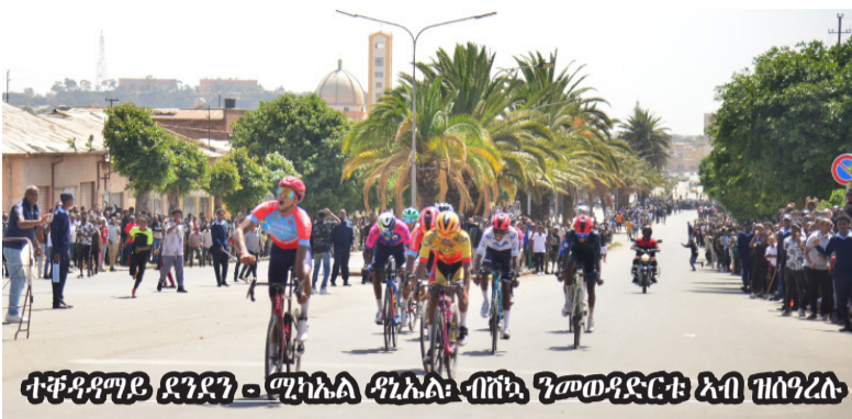
ተቆይሞሚት ደንደን - ማእከል ማእከል ብሞህሮ ንመድረኽታ ኣብ ዝሰገረሉ

ብርኽቲ ፍሳሪ - ዓራቂ ርዕሲ ብርኽ - ደንደን ሄርግላ ስምኡን - ጋንታ ደቡብ ብውልቅ ዝዘወደረት ኣልግም ኒገቹ ክብ