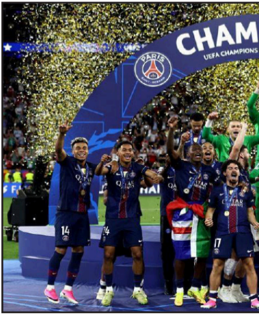
ሰምበልን ሰገን ስታዲየም

ኣሰባኤ ኣብ ሃንጋሪ ማዳ ፕሮጀክት ዝተፈጸመ መዘዘን ጸውታ ኣርፍል ኣብ ሻዳሽይት ደቂቕ ብመሃዲ ካይ ሃሰርኻን ስታዲየም ብምግባር ብኣገራ መራኪት ሓቲ። እዚ ጀርመን ኣብ 2021 ናይ ቅድም ክሰብ ተፈላ። ግምት ስቲ ሰራገ. ዘ. ውድድር ኣብ ዝዘገዘገዙ ኮኔ እንኮ መወገት ስታዲየም ምዃራ። ጎሳ ስታዲየም ከመዘዘኡ ኣርፍል ተሳታፊ