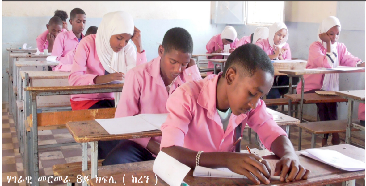
ሃገራዊ መርመራ 8ይ ክፍለ (ከረገ)