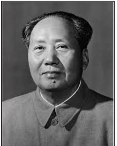
መራሕ ቻይና ዝር ማእ ጸዩንግ

ድሕሪ ሞት ግእ መራሕታ ቻይና ዝኾነ ሆን ፎን እዩ። ምርሓው ቻይና ንርእሲ ምጥባይ ዓለም ከኣ ብኡ ንብኡ ናህሩ ቀጸሎ። ቻይና፡ ልኡኻታ ናብ መላእ ዓለም ሰደደት። ምስ ሃገራት ወጻኢ ዝዩድ ልውውጥ ቅልጠፍ ስጦት ኣርእዩ። ኣብቲ ዑደት ዝተሳተፉ መራሕትን ምሁራትን ቻይና ከኣ ካብቲ ምዕራባዊ ዓለምን ጎረባብቶም ሃገራት ምብራቕ ኣሊዮ ክንዲ ምንታይ ድሕርም ምጥባይም ተገዝበ። እቲ መሸታት ደማ ነቲ ናይ ምርሓው ተጠባሪ ሓደሽ መልክዕ ኣትሓቲ። ምምሰራት ዲፕሎማሲያዊ ዝምድና ምስ ኣመሪካ ኣብ 1979 መራሕታ ከ-ነት ኮይኑ፡ ኣብ እረማ ቻይና ናይ ሆን ፎን ዝገለጸ ኣብርክቶ ደማ እዚ ምዃን ይግለጻ። እንተኾነ ኣብርክቶ ሆን ፎን "ዝኾነ እንተኾነ" ምስ ዝበል ንውሳኔን መሰመርን ግእ ዝደግፍ ጭርሖ ሞራይ ተዛምዶ ይግለጽ'ዩ። እንተኾነ ድሕሪ ሞት ግእ ንምእ ክብሪ ምሃብ ሆን ፎን ባይኑ