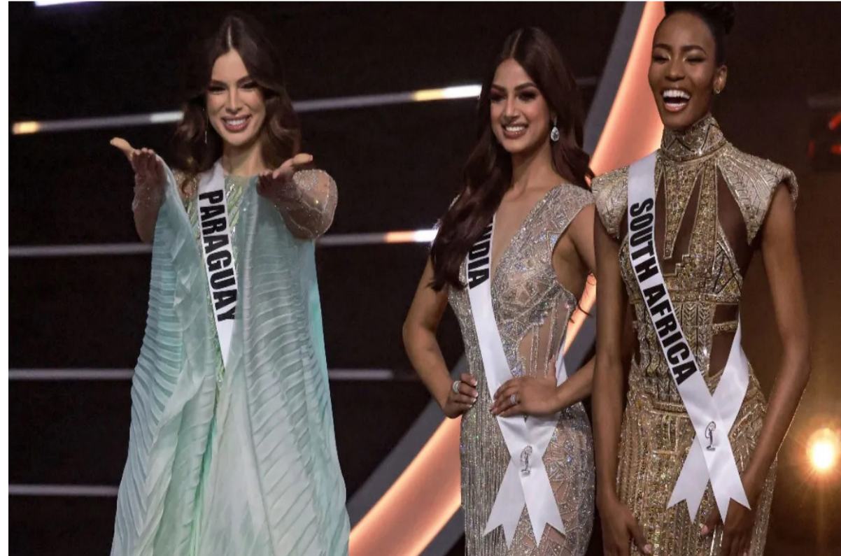
ኣክላል ተግዳራት ኣይ። ብክልእ ኣዘርቡ ስውዓት ስኒዘዩውያን ወይዘራዝር ኣክላል ‘ወይዘራት ኣድማስ’ ደረጃን ኣለዎ ማህበራት። እዚ ኮፎ ስኒዘዩ ብቐንጅናኣን ዓለም ዘዘርብ ምልክት ወይዘራዝር ብጠኪኪ ዝርከብ ሃገር ምዃና ዝይምጥ ምዃን ብተሓት ክኣሊታት ናይቲ ዓውዲ የረድኡ።

ብደረጃ ዓለም ዓመታዊ ዝዩድ ውድድር ቁንጅና ደቂ ኣገባብ። ሓይ ካብቲ ኣቐልቦ ማህበራት ዘኖን ማሕበራት ኣ.ን.ዳ.ሰ.ሪ ፋሽንን ዝህከብ ንዋሪት። ኣብቲ “ወይዘራት ኣድማስ” (Miss Universe) ዝበል ኣክላል ዓወት ንምድፋእ ዝዩድ ውድድር ብቐንጅናኣን ካብ መሳላ ዓለም ዝተወለ ደቂ ኣገባብ እዩን ዝተሓፋ። እቲ ውድድር ኣብ 1952 ካብ ዝጀምር ንደሓ ኮፎ ብዘይኣ ሃገር ስኒዘዩ ኮፎ ኣክላል ዓወት ኣከታተላ ንክልተ ዓመት ዝተወተትላ ካልእ ሃገር የሳ። ሰይፋኒዶ ሪርናንደዝን ዳይና መንደዝን ክልተኣን ደቂ ስኒዘዩ ኮይን። ሰይፋኒዶ ኣብ 2008 ኣብ 18 ዓመት ስድመኡ ዳይና ኮፎ ኣብ 2009 ኣብ 22 ዓመት ስድመኡ ንኸለን መወድድርቲን ቢጸን ኣክላል ብምድፋእ “ወይዘራት ኣድማስ” ኣብላ። ስኒዘዩ ኣብ ዝተፈለገ እዎን ብክልተ ሓመት ተወዳደርቲ ቀናጁ ኣብላውን ኮፎ