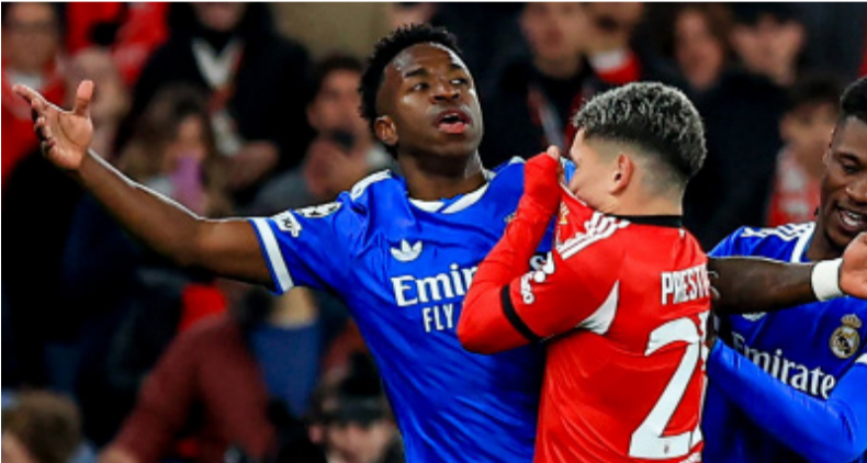
ሓዳሽ ሕግ ክወደእ ዝቐሰበት ፍጻሎ፡ ፕሪሲኒድ ኣፍ ብምልድ ሽፊት ኣናተዛሪ

ንመዘገብ 23 ዝዩድ ሞንጊ ዓለም ደቂ ተባብሮ፡ ኣብ ሃይራት ኣመጽኦ መኣዘን ክፍገን እዩ ክኸደ። ሓምሳ 11 ሺ ሰንገራ 1000 ድቀ ደሜ ብወጥታ መኣዘን ደቡብ ኣፍራቃን ክፍልም እዩ። ኣብ ዋና ከተማ መኣዘን ስቲ ዝርከብ 87,523 ተግዘብ፡ ዝኸበ ኣዘዘን ስታድዮም እዩ መክራት ጸውታን ጸንገልን ከፍድኦ እዩ። ናይ ልሎ ስታድዮም ንሰላሳ መክራት ጸውታት ሞንጊ ዓለም ዘደገደ ደማ ክኸውን እዩ - ንደ 1970ን 1986ን መክራት ጸውታት ኣፍጻኡ ብምንጭ።