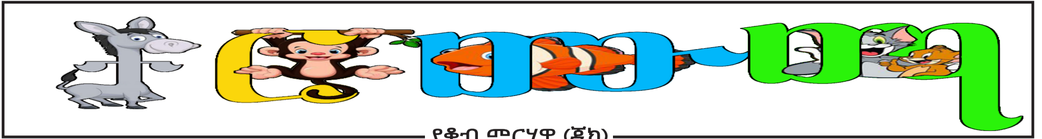
ያቆብ መርገዳ (ጃክ)