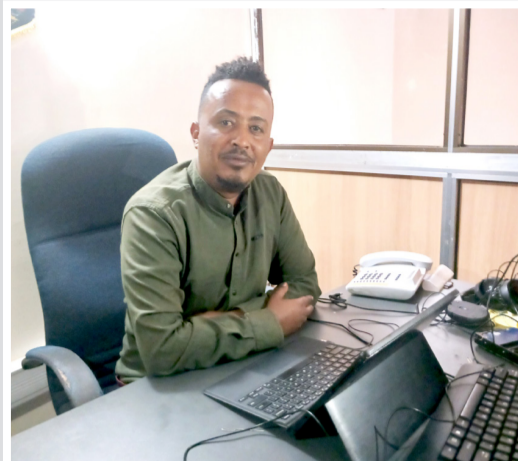
መንእሳይ ሚናስ ለኣክ

ውድድር ምህዞን ሰንዓን 2024 እዩ ጀሚሩ። ቅድሚ ሕጂ ኣብ ኣጋጣሚታት ኣጸቢብካ ዋሪይዮ ዝካየድ ነይሩ። ማለት፡ ኣብ ቅኝ ተመሃሮን ካልእ ፈሰቲሻላትን ኣቀራቕርካ እዩ ዝካየድ ነይሩ። ሕጂ ግን ብስርዓት ማእከል ምህዞን ዋሪንን