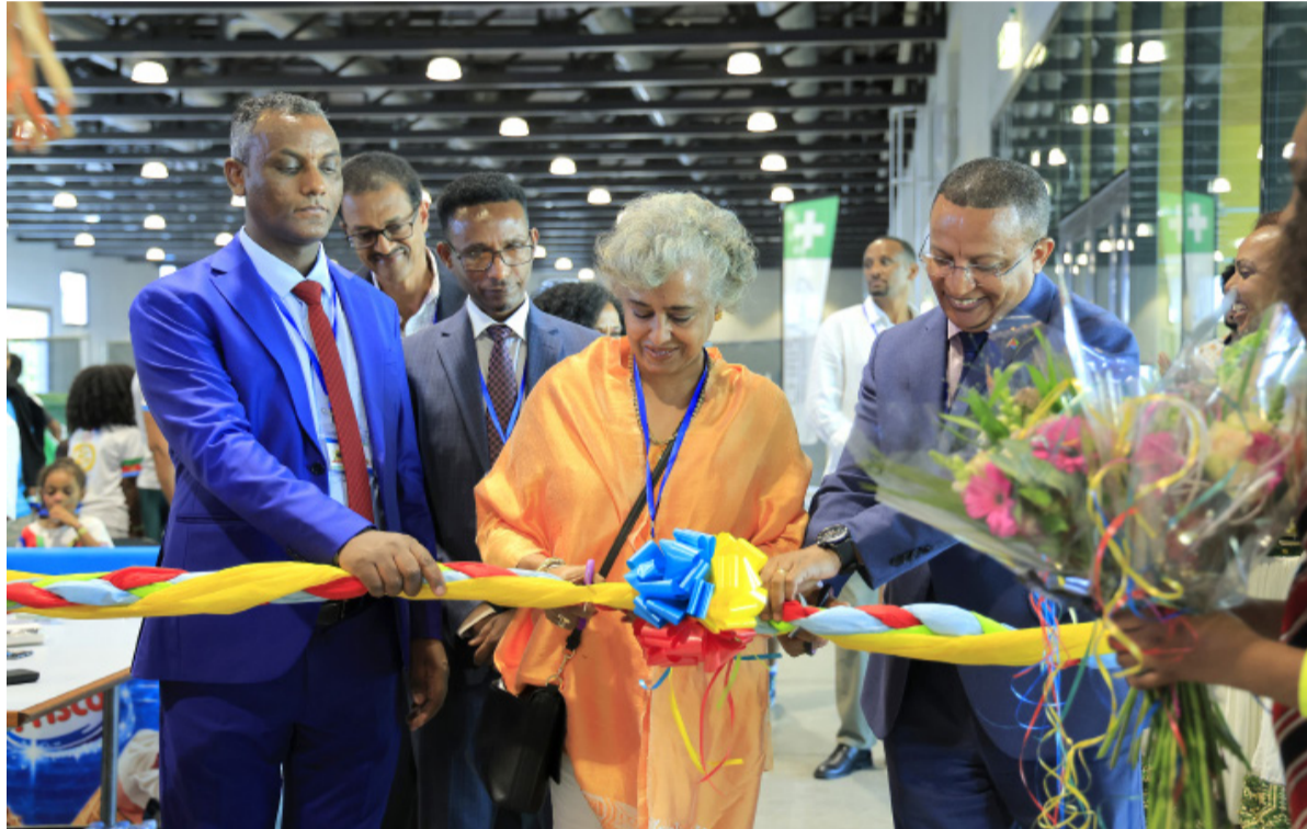
ዝገልጹ ኤርትራ እትውገኖ ሕርሻዊ ፍርያትን ባህርያዊ ጸጋታትን ኮምኤውን ይታዊ ኣልባኮት ብሄራት ኤርትራ ይርከቡ።

እቲ ብመልክዕ ውድድር ዝቐረበን ዓቢ ኣድናቕት ዝረገገን ትሕዝቡ ንባህልን ልምድን ሕብረተሰብ ኤርትራ፡ ማሕበራዊ ፍትሒ ገምርግጽ ዝተካየደ ጸዕሪን ገሊጹን፡ ንታሪኽን ክብርታትን ህዘቡ ኤርትራ