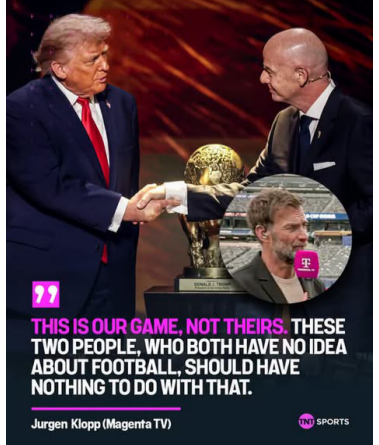
THIS IS OUR GAME, NOT THEIRS. THESE TWO PEOPLE, WHO BOTH HAVE NO IDEA ABOUT FOOTBALL, SHOULD HAVE NOTHING TO DO WITH THAT. Jurgen Klopp