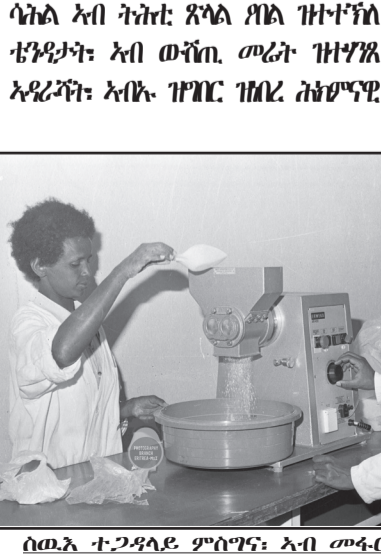
ሰውራ ተገዳይ ምስግና፣ ኣብ መፋርቕ 80ታት (ኣብ ሚያ) ኣብ ምምሰራት ፋብሪካ መድሃኒት

ብድሕራይ፣ ተኸሰት ስለ ዝርከብ ኣብ ልዩም ዝሰረ ኣግራብ ዝሰረ ቦታ እናተጸገዐ ብኣግራብ እናተሰለ ሰርቀጠ ገሰሰ ክድይብ ጀመሩ፣ ካብ፣ ሰርቀጠ ቦታ ክመር ከሎ ደማ ኮም እጅጊ ዘይተረረ ህጽን ብኩሕ ጥፍና ከሎ ደመር ነረ፣ አብ፣ መጀመርታ መልክት ካብ፣ ጎረ ንታሕት ክመር ከሎ፣ ኣፍልሎ ተግባሱ ምክንያታት ስኢን፣ ብምሓር ማእሰይ ምክራብን ምክንያታትን ስለ ዝሰረ እንታይ ኮም ዝሰር ሓርቲ፣ ደሕራ ገለ እዋን ግን አብ ከባድ ገለ ሃር ቶግ ሰፊ፣ ክትኸሰ ደማ ጀመሩ፣ እዚ ደማ ምናልቡ ዝተሰፈዩ መገንገሉ ተቐጺሩ ይራ ክኸውን ይኸታልዮ ዝሰል ምን ሓይሎ፣ ሰባ ጸርኪ ደማ ሞናይቲ