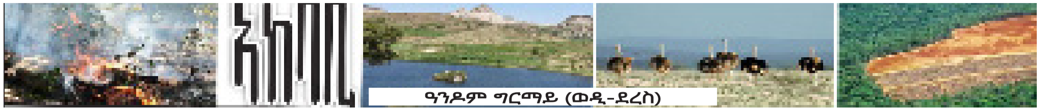
ዓንደም ግርማይ (ወዲ-ደረስ)