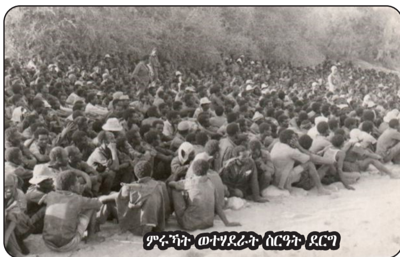
ምፍራስ ወተሃደራት ሰርገት ደርግ

ክቡር አገላለጽ፣ አብ መዘገብ 23 ክፋል ትረካፍ፣ ብዛዕባ አማካኝነት ተመክሮታትን ብርጌዳት ክ/ጦር 18፣ ከምኡ ወን ካብ ዕለት 24 ለካቲት ጀሚሩ ናብ ጸጋማይ ግንባር ናቕፋ ብምእታው ንዝገበሮ ፈተነታት መዋቃሮቲ፣ ምስቲ አብ ወርሒ መጋቢት 1982 ናብቲ ግንባር ዝተጸገበረ ብርጌዳት ክ/ጦር-2 ተወሃሂዖ ንግንባር ጸሊም ነ/ብ 1826 ንምቀጽጻር ብጸቢብ ቦታ እናበሳሰነ ደፋሪ ሰራዊት ህዝባዊ ግንባር ንምፍራስ ዝፈተነ መዋቃሮቲ ከም ዘይሰለጠም ርእይ ነይርና። ብፍጋይ ክ/ጦር-2 አንፈት መዋቃሮቲ ንጸጋም ብምቕያር ናብ ነ/ብ 2059 ፍቕሩ ፈተነ ከም ዝገበረ፣ ንድሕረ-ባይታን ተመክሮ ውግእን ብርጌዳት ክ/ጦር-2 ንምግላጽ ብፓራቲማንዶ ብርጌዳ-2 ጀሚርና ኣይ ብኣይ ክንገልጸም ከም ዝጀመርና፣ አብ መዘገብ 24 ክፋል ናይዚ ጽሑፍ ደግሞ ንተኸታተሊ ጽሑፍት ሌ/ኮሎኔል በዥራዪን ንብረሚካኤል (ኢ.ፕ.አርፕ) ወንዚፍና፣ አብ “ናቕፋ ትረካፍ አላን” ታባ ውፋ.የትን ብዛዕባ ዝተኻየደ ውግእት አመልካቲ፣ አባል ቦሎቲ 58.3 ንዲም ተጋግላይ ወለደሚካኤል ተኸልሰንበት ንዝፈለገና ተመክሮን ዝሃበና መኣሪምታን አቕራቢናልካ ነይርና። አብዚ ናይ ሎሚ ትረካፍ እምበኣር፣ ነቲ አብ መዘገብ 23 ክፋል ጀሚርናዮ ዝነበርና ሌላ ምስ ብርጌዳት ክ/ጦር-2 ነቕርበልካ አለና።