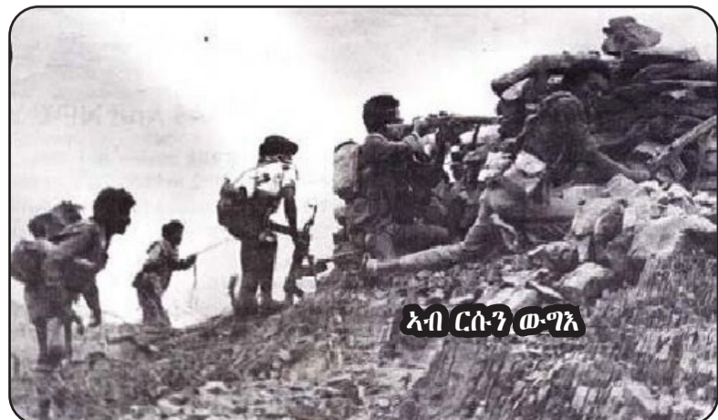
ኣብ ርሰን ውግእ

ነቲ ቦታ ብምሃብ ምፍላጥ ክሰራታት እናገውሐይ ይኸይድ ነይሩ። ከ ኣህዳታት ሓዘን ዝበራ ቦታት ተኸታ (ጸሊ. ቅለፅ) ስለ ዝበረ ብኸነራ ክኣት ዝኣል ኣይሰራን። ኣብቲ መጀመርታ ንኸሉ መስሎ ቦታት ክበድ ብረት ኣሰራሉ ስለ ዝበራ ወላ ግመ እንተሰራ ክትከታየኹ ኣጸጋሚ ነይሩ። ለይቲውን ፊትታት ምዋቃሮቲ ደብዳቤ ክበድ ብረትን ደው ስለ ዘይሰራ ልጹም ዝይኣስ ተጋግላይ ኣይሰራን። ንምረታት ምዃራ ከተህይድ ምዃራቲ ክትከር ሞርን ስለ ዝኸኑ እምቲ መተሓላፊ መገዳ ጸሊ. ቅለፅ ብምሃሩ ሓይላይ እዮናት ተጋግላይ ክሰብ ክኣት መወጃታት ብይ መዘ. ጸዮም ዝውሰሉ ከታት ነይሩ። ኣብ ኣርወ ክሰብ ፍርቂ ወርሒ 4/82 ቀጸሊ ደብዳቤ ሓይላይውን ነቲ ቦታ ንምሓዘ ፊትታት ወጭ ይደድ ነይሩ። ብወን ህዝቡ ሰራዊት ነቲ ዝበረ ደፋሪት ኣተኣሰርካ ንምሓዘን ንምደልዳራ መተሓላፊ ክፍሊት፣ ደፋሪት፣ መቐብ ዝውጥ መርከብ ህድም ዝኸውን ኣግራብ ኣብ ምፍራጽ፣ ምንቃይ ምዃራቲ ጸሊ እናተኸሰሰ ንምሓዘን ክህይድ ነይሩ። ምዃራ ክኮይ ናይቲ ግንባር - ክበታት መዋሮቲ ቀዩ፣ ተርጠጠ፣ ርረት፣ ርረት፣ ከብን ተርግዝ - ኮም ቀጥምን ቀንደን ደፋሪት ህሊ ዝርእ ዝበራ መዋሮቲ