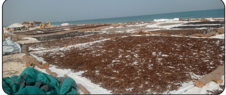
ምምሕራሕ ሕድራ ኣብ ደሲታት ኣርቲራ