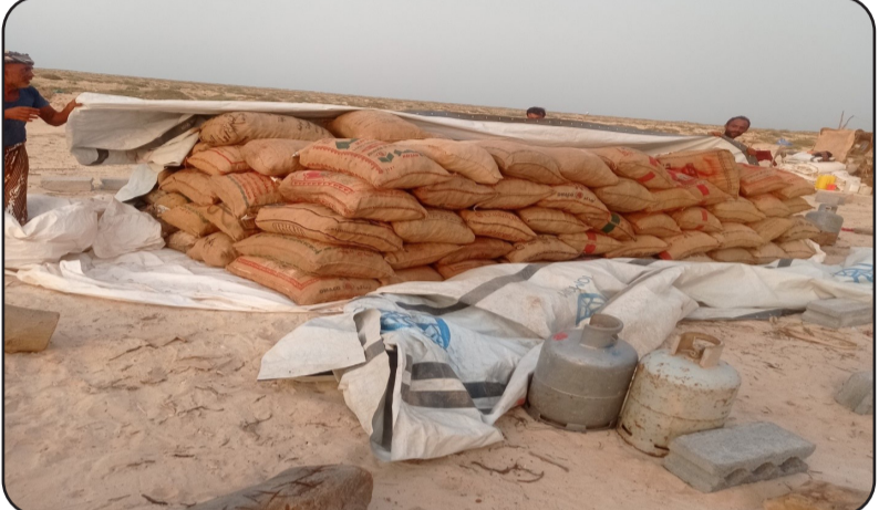
ምምሕራሕ ወዲኡ ንዕዳጋ ድለው ዝኸፈኩ ሕድራ

ተክፍቲ ይኸበርዎ። ገላ ሓሊታት ሕድራ ማለት እቲም ኣብ ዕዳጋ ቀጣጣይ ደረጃ ዝበርዑ ኮም ብዓል ሱሊ-ጌቲ ፍሰሲቲን ፍብልቫን ካልኣትን ብጸም ደረጃ ኣብ ሓደ ምጽናት ኮም ዝርከቡ መጽናዕታት ይሕብሩ። ሰላዚ ንክፈሉ ተጠቃምነት ጸጋታት ባሕሪ ሃገርን ምውሓስ ሕድራ ዝገፈፈሉን ዝጸወሉን ወቕቲን ቦታን ብገበኣ ተለልዮም ናይ ምሕደራ ኣገብ ዝኸፈኩ ኣገፈር ምርጫን ክፍሉ ኣገልግሎት ሕጋጋትን ቀጽጽር ባሕርን ማህበራ ኣበርቲም ዝርከቡ ዘለዉ ንጥራት እዩ።