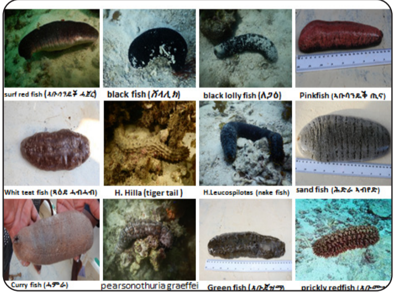
ገላ ካብቲም ኣብ ኣርቲራ ዝርከቡ ሓሊታት ሕድራ