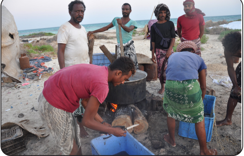
ገፈፍቲ ዓላ ሕድራ ብሓዊ እናኣብሰሉ