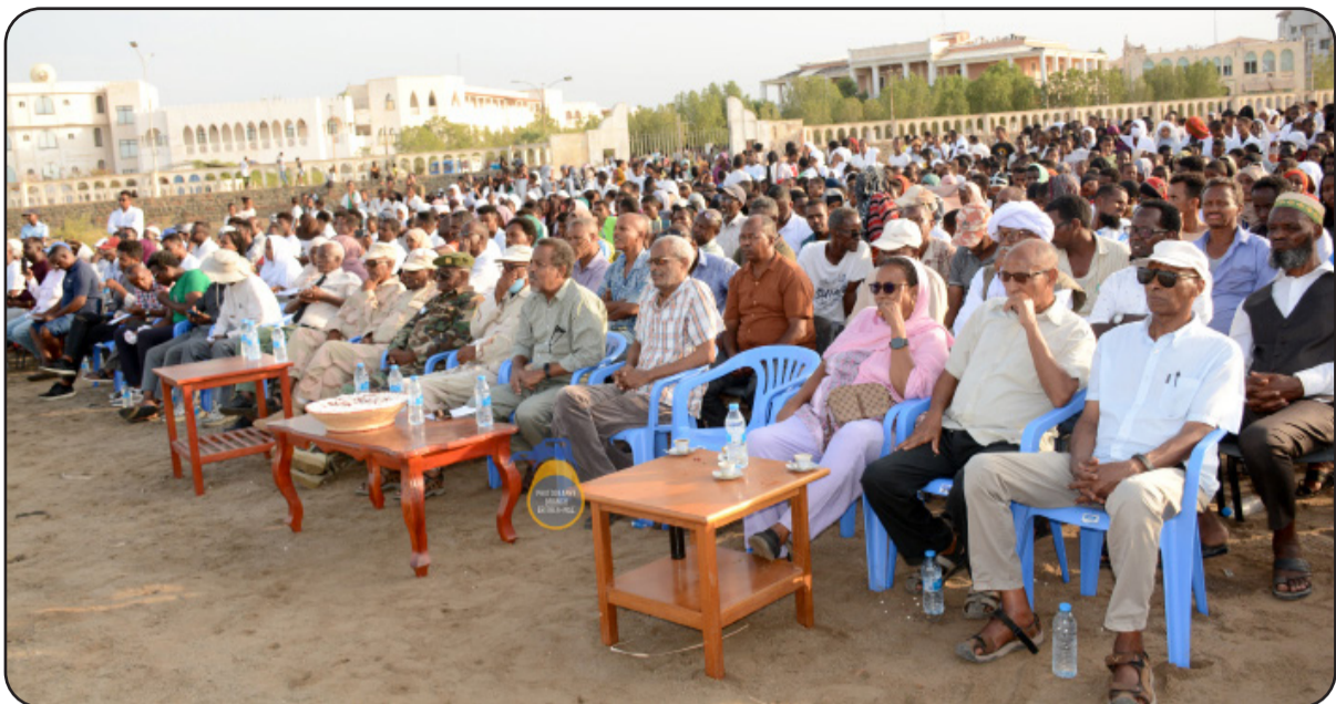
ምግብ ክራሕ ብምዝኻኑር ምኡ ኣረጋገጸ። ወ-ልቀ-ተመሃሮን ትሕሳንን ንዝተወቱ ስልጣን ተዓዘሉ።