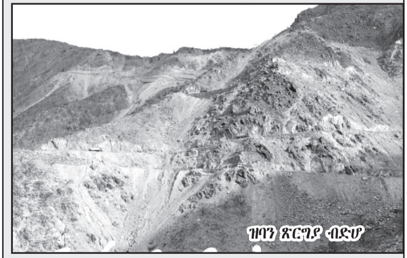
ዝባን ጸርጊዎ ብደም

ኣብ ኣዳን ሰው-ራ ገርጊዎ ብደም ርጅም ዘይደንቕ ኣይነበረኹ፡ ምናልባትውን ኮም ኣይነበረኹን ዝተከረኩን ጸርጊዎ ዝገበረ ኣይመሰከሩን፡ እዚ ዘይንቕ ኣብ ዓለም ኮምኡ ክገበር ዘይኣኣል ኮይኖ ኣይነበረኹ፡ ኣንታይ ደኡ ብደራፍ ተርታቲ ቃልሲ ብተኮየዘ ግኑ ክንዳዘ ዝኸተቐ ጸርጊዎ ምስክር ቀላል ስለ ዘይነበረ፡ ጸርጊዎ “ብደም” ኣብ ኣግራ ማይ ጨላይ ክኮሰ ክሰድ ማግኢኹ ብኸነዩ ሰፍል ትራ ዕቃስ 37 ኣገላለጻት እናተጠዉዉ “600 ማትር ብራኽ” ምድዳብ፡ ብተራ ተግቢ ዘይደንቕ ኣይነበረኹ፡ ካልኣ