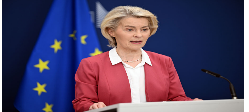
ኮሚሽን ሕብረት ኣውሮጳ ገዳነት፡ ፋይናንሻል ኣገልግሎታትን ግድን ዓላማ ዝገበረ መዘገብ 21 ዘርፍ እማመ እገዳ ኣብ ልዕሊ ናሲያ ነፃ ዝቐረቡ ፕሬዚዳንት ኮሚሽን ናይቲ ሕብረት ኣርሲላ ገን ደር ለያን ትግል ሰለሰ ገለጹ።

እቴ ኮሚሽን ብተወሰነ፡ እቴ እማመ ኣብ ግድን ምምህራብን ነዳደን ናሲያ ዝገለጹ ወደባት፡ መዳርባት ሄሮኒን ትሓት መጻገይ ነዳደን ገደብ ምግር