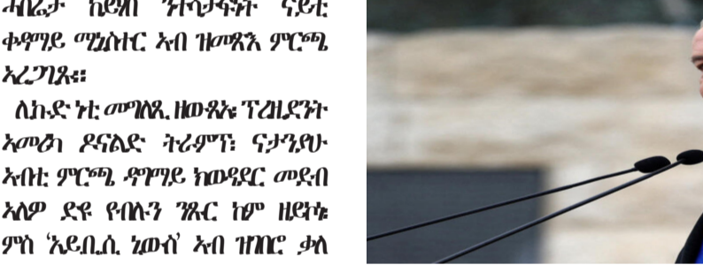
ቀዳማይ ሚኒስትር እስራኤል ቤንገሚን ናታንያሁ፡ ኣብ ዝቐጸል ምርጫ እስራኤል ክውዳደር ምዃና፡ እቴ ጎሱ ዝመርኮ የግደዎ ኣጠምታት ዘለዎ ሰልፍ ‘ለክድ’ ትግል ላይ ኣፍላጠ።

ሰልፍ ለክድ ኣብ ዝዞ ሓጻር መደባት፡ “ናታንያሁ፡ ኣብ ዝመጸኡ ምርጫ ክውዳደር” ክብል፡ ዝርዝራዊ