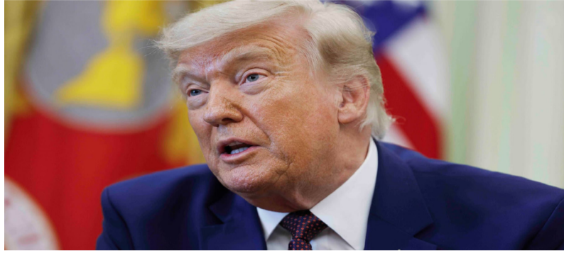
አሙሪካ ዘለም ዲሞክራሲያዊ ርዕሰ ግዛድ ትራምፕ፡ ኢራን ዋጋ ከትኩፍል ምዃና ትግል ላይ ሲገባ ለዚህ ደረጃ ምክንያት ሆኗል።

ፕሬዚዳንት አሙሪካ ዶናልድ ትራምፕ፡ ኢራን አብ ስምምነት ስምምነት አገዛዝ ላይ ከሆነው በኋላ ደግሞ የዋጋ ከትኩፍል ምዃና ትግል ላይ ሲገባ ለዚህ ደረጃ ምክንያት ሆኗል።