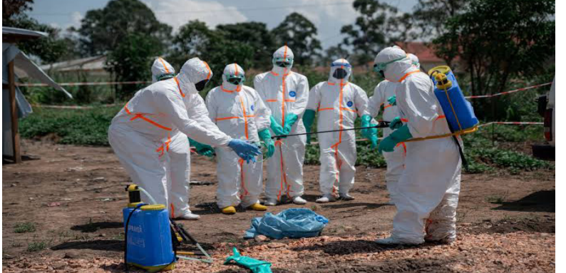
ቀጽሪ መልክቶ፡ ናብ ልዕሊ 550፡ ቀጽሪ ምወታት ደማ 115 በጺሑ ምህላወ ኣመልኪቲ።

ኣብ ደሞክራሲያዊት ሪፓብሊክ ኮንጎ፡ ቀጽሪ ብሕገም ኢቦላ ናይ ዝሞቱ ሰገት ልዕሊ 100 ነፃ ዝበጽሐ ተሓብሩ።