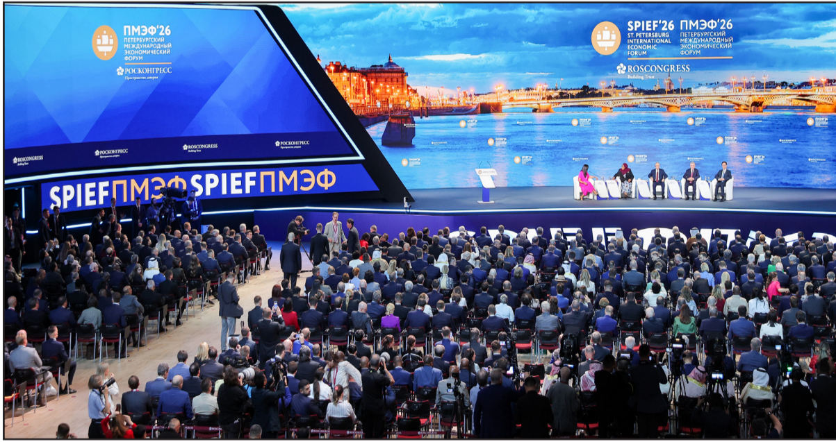
ርክብት ብምክያድ ኣብ ሓድሕዳዊ ምትሕገግ ተዘራረቡ። ህዝባዊ ምሕደራን ምርኩስ ዝገበረ ዘተታት ተኻየዱ።