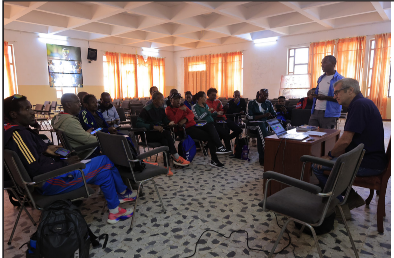
እብ ስልጠና ን3 ዓመት ክቐይሩ ተመዳቡ ከም ዘሉ ብሞላዮ 60 ናይ ሰባል 2 ደረጃ ዘለዎም ኣሰልጠንቲ ግምገማይ ዓለሙ ደረጃ ከም ዘሉ ገለጹ።

አብ ስልጠና ዝተሳተፉ ኣሰልጠንቲ ናይ ቀዳማይ ደረጃ (level 1) ዝገኙሎም ኩይናም ብክሰሉ ሓሳብ ስልጠናም ተኸታተሎም። እዞም ስልጠና ኣብ ወርኪ መካኒም ሞሪዊ ስልጠና ክወጹ ምዃናም ተፈለጠ። ቅድሚ ሕጂ ናይ ካልይ ደረጃ (ሰባል 2) ስልጠና ኣብ ወጻኢ ሃገር ዝወገበ ዝበረ ኩይና ሎሚ ዓመትዮ ንፊላም ግዜ ኣብ ኤርትራ ተዋጊዖ። ሃገራዊ ፊደሪስ ኣትሌቲክስ ኤርትራ ኣብ ዝሰጸገሎም ሓብራታ