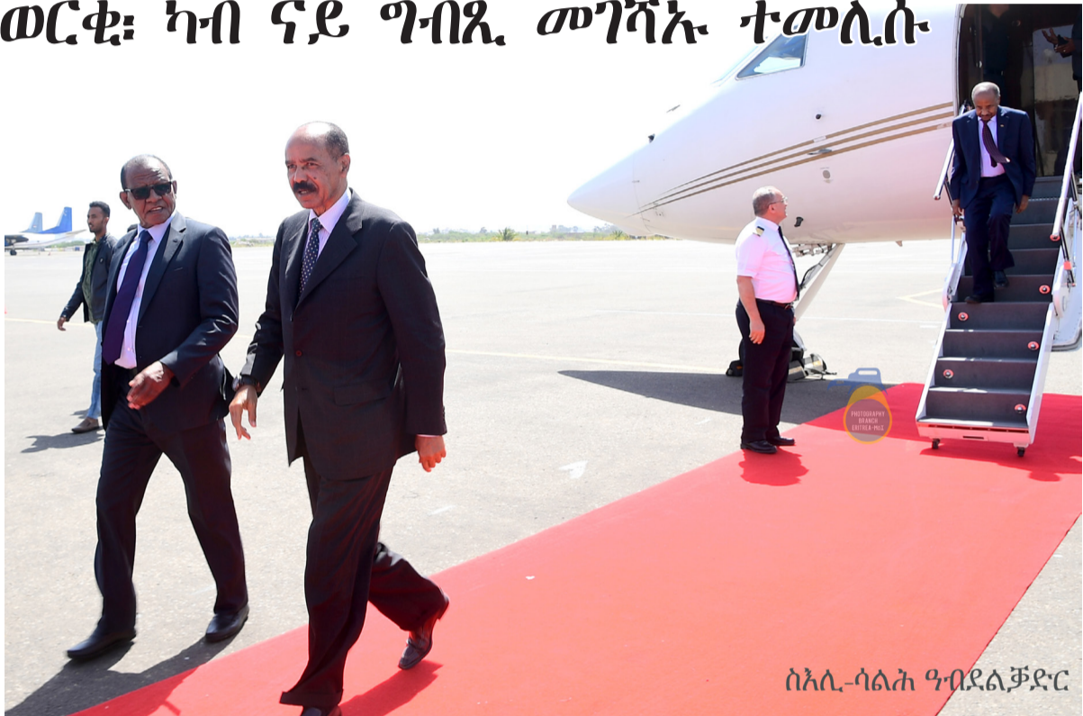
ስኢሊ-ሳልሕ ዓብደልጃደር ሰይጣን፡ ፋብሪታት ሓጺንን ቸሚኒቶን፡ ኣሱኻናን ኣብ መሰርሕ ህንጻት ኮርፖሬሽን መሰሪታዊ ኢንዱስትሪ ግብጺ፡ ከምኡውን ወደብ ዓን- ኣሱኻናን ኣብ መሰርሕ ህንጻት እትርከቦ ሓዳስ ርእሰ-ከተማን ዘጠቓለሉ ነይሩ። ማህበራዊ ዕሰማን ሳልሕ ምስ ፕረዚደንት ኢሳይያስ አፈወርቅ ሓብሩ ገይሹ ነይሩ።

እዚ ከምዚሉ እንክሎ፡ ፕረዚደንት ኢሳይያስ ምስኡ ዝተገብረ ጉጅለን ካብ ከተማ ካይሮ ኣብ ዙርያ 150 ኪሎሜትር ናብ ዝርከቦ ኣፍሪቃን ወሃብቲ ኣገልግሎት ትኣላትን ዘደድሙ ዑደት፡ ትኣል መፍሪ መድሃኒት 'ጂፕቶ ፋርማ' ቁጠባዊ ዞባ መትረብ