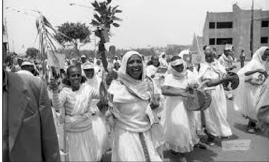
ህዝብ አርትራ ዝከበደህን ኣላሽ ዝህሉን ደርገብም።

ስነ-ተጻፊዊ ኣቀማግላ አርትራ ዝሰጠሎ ሓይልታት፡ ክብ ሞኑ ኣትከተም ንአርትራ ምግባፍን ምጻጻርን ሃዩ ኣይደም እዮም፡ አብ ዝተገለጸ መድረኽ ታሪኽ ዝመጽኡ ገደብ ኮሞ ተርጎሞን ግዘጸውያን ኣጠቃላይ-ያን ብምክትን ጸገገንን ኣትገጽዎም ናይ ብምክትን ጸገገንን