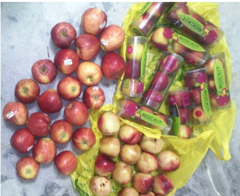
ብዘይ ሕጋዊ ኣገባብ ብመግቢ ነፈርቲ ክኣቲ ዝተታሕዘ ውጽኢት ብቕሊ

ጉድኣት ከየውረዱን፡ ተቐላጠፍካ ክሰፈሩሎን ኣብ ልዕሊ ምህርቲ ኣብ ቁጽጽር ምእታዎም ወሳኒ እዩ። ኣብዞም ዝሓለፉ ዓሰርተታት ዓመታት፡ ኣህጉራዊ መንግስታትን ንግድን፡ ኣብ ምስፍሕፍሕ ባልዓትን ሕማማትን ዓቢ እጃም ተጻዊቱ እዩ። ስለዚ፡ ብቕሊን ውጽኢት ብቕሊን ኣብ እንግዳሕ እዮን፡ ካብ ባልዕ ናጻ ምዃናም ኣረጋገጽና ከገገዎዎ ይግብኣና።