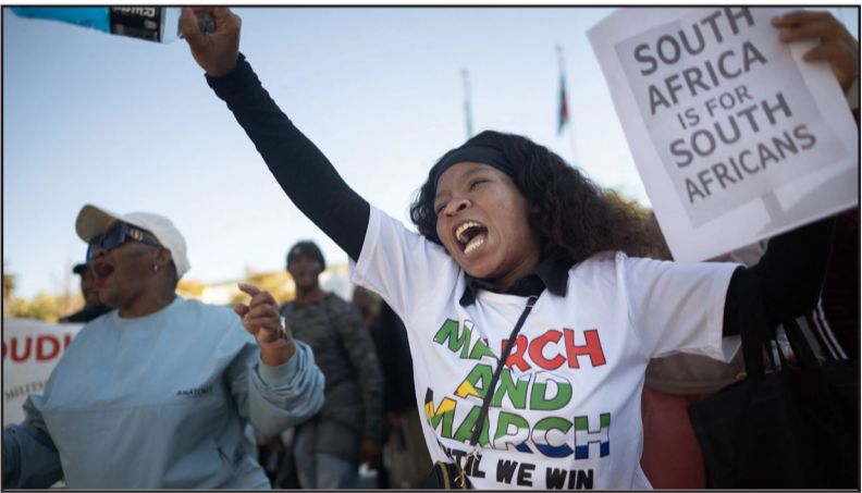
ጉዳይት ወጸኢ ጋና ሓብሩ።

እዚ ኮምቢሎ እንገሎ መምህሮ ናይጃርያ፡ አብ ደቡብ አፍሪቃ ዝርከቡ ብውሕዱ 130 ዜጋታት ብጸራት ናብ ሃገርን ክምህሉ ሓቲየም ኮም ዘለዉ ሓብሩ።