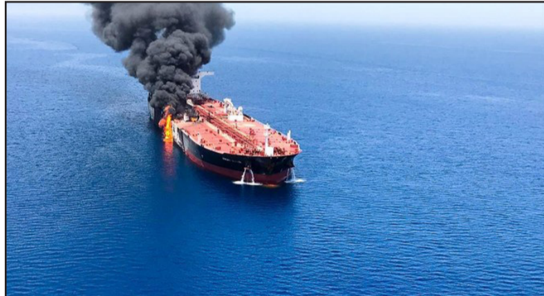
ኣራን ናይቲ ከተሃሪ ኣብ ዝሞ ሓብራታ እታ ዝተለፈ 4 ግንቦት ብኸልተ ሰብ አልቦ ኔርቲ አራን ዝተሃርመት ባሕሪ እትህል መርከብ ኣብ ገምም ባሕሪ

ይኸምሃር፡ ሳህላይ ብጸል ሰልጣን ኣብዚ ኣራን ብሰብ አብ ዝሞ መሃሊ፡