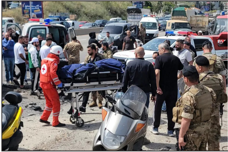
ኮም ዝቃወም እዩ ዝጠልጽ ዘሎ።

አብ ሰሜን እስራኤልን አብ ደቡባዊ ሊባኖስ አብ ልዕሊ ዝርከቡ ሓይልታት እስራኤልን መጥቃዕቲ ክብሪ ዝጸኑሉ ሕዝባዊ ነቲ አብ አመልኪ ዝቐረጹ ዝርከቡ