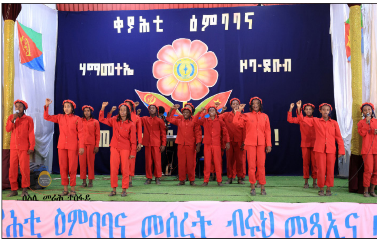
ሰልጠና መሪሕ ተሰፋይ ዝተደግመን ደርፍታትን መዛሙርን ከምዘኸፈኑ ጠቕላላ፡ ብፍላይ ኣደሳት።

ክብ ኣወሃደቲ ናይቲ መደብ - ስነ-ጥበባዊ ሸሻይ ኣይለኣብ ኣብ ዝሞገም ግምገማ፡ ብኣራጃ 55 ኣደሳትን