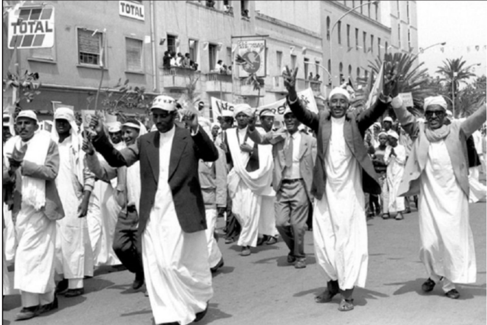
ኮሞ ጸገገን፡ ቅርጻት፡ ርክብ፡ ተ ወ ፋ ይ ነ ት ፡ ብደዳኛ፡ ሓዩን፡ አብ ሕብረተሰብ አርትራ ገደብ ምጻጻ፡ ገደብ እዮም፡ ተጋዳይ ህዝብ ግዳር አብ ግዜ ብራታዊ ቃል ዝህረ ምጽዳድ ብደዳኛ መኸተን መኸተን መሰረቱ ኣብቲ ዝገለጸ አርትራዊ ስድራቤት ምዃና ኮሞ ርዳኣ ደውሰደ።

ዓውሎምን ዘመናውትን ዝፈጠር ህዝብ ዘለዎ ህይወት ሓይራታት፡ ምጽዳድ ተራ ስድራ ቤት አብ ሃርገን ሕብረተሰብ እዩ፡ ስድራቤት ኣገዳሲ ማሕበራዊ ኣካል ኮሞ ምዃን ዝህረ ተራ አብ ዘመናዊ ሕብረተሰብ ጸም እናገደሉ አብ ምጽዳድ ደርገቡ፡ ወልቃውነት፡ ሰቡ ፍትወት ሃሪወት፡ ትሰብ፡ ኣገኛ፡ ምግዳል ክበርታት፡ ምፍርኻሽ ባህ፡ አብ ብዘተት ህዝብታት ጸም ከበድ ጸም አብ ምፍጠር ደርገቡ።