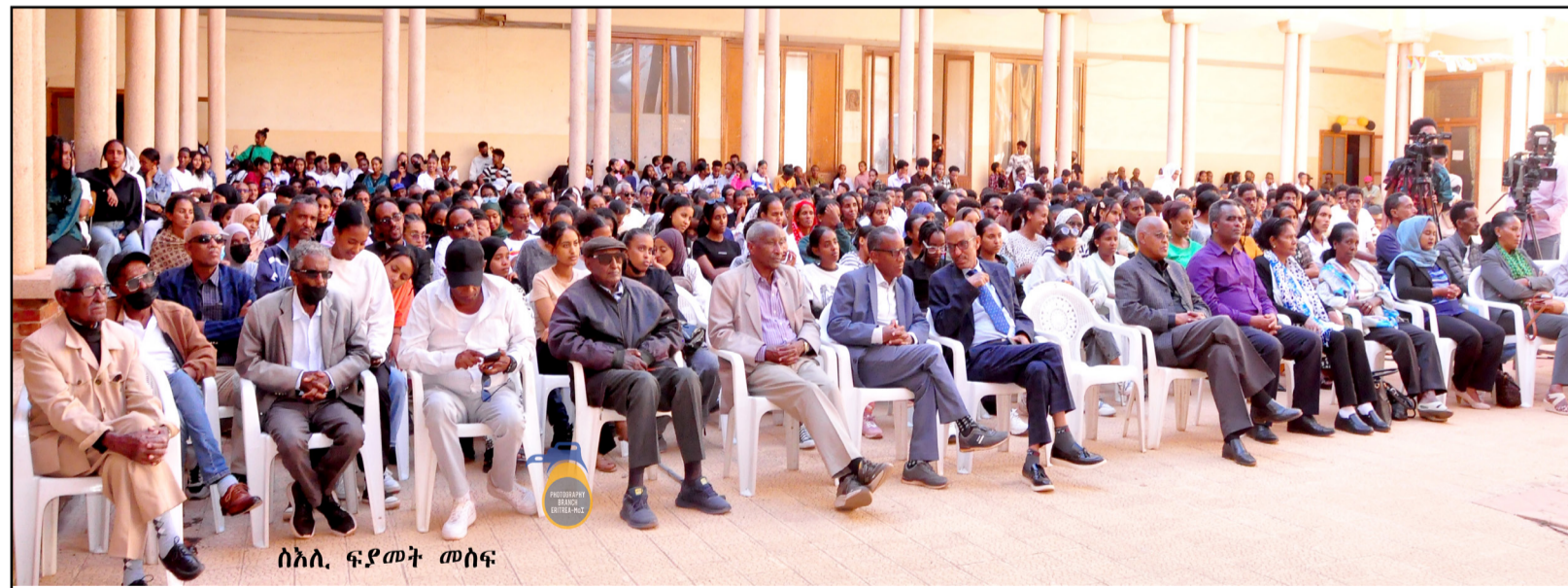
ሰኔ 14፡ ፍ.ደ.መ.ት መስፍን

መዘገብ ስነ-ሰርዓት መዘገብ 13 ዓመታዊ ፈሰቲኻል ኮለጅ ሕክምናን ስነ-ፍልጠት ጥዕናን ኣሮታ፡ ብ12 ሰኔ ኣብ ኣሰመራ - ቀጽሪቲ ኮለጅ ተኻየዱ። እቲ ፈሰቲኻል፡ ብመልክዕ ውድድር ንሸድሻት ኣዋርሕ ዝደገጸል - ኣብ ትምህርቲ ባህልን ስፖርትን ዘተኩረ መሰናድኣታት፡ ከምኡውን ምርኣት ቅዲ ኣልባሳትን ገሪጎስ ሕክምናዊ ትምህርትን ዘገጸባርቅዮ ነይሩ። ዲን ናይቲ ኮለጅ ዶ/ር ዮማክ ስዩም ኣብ ዝሞ ቃል፡ እቲ ፈሰቲኻል - ዓቕምን ንቅሓትን ተመሃሮ