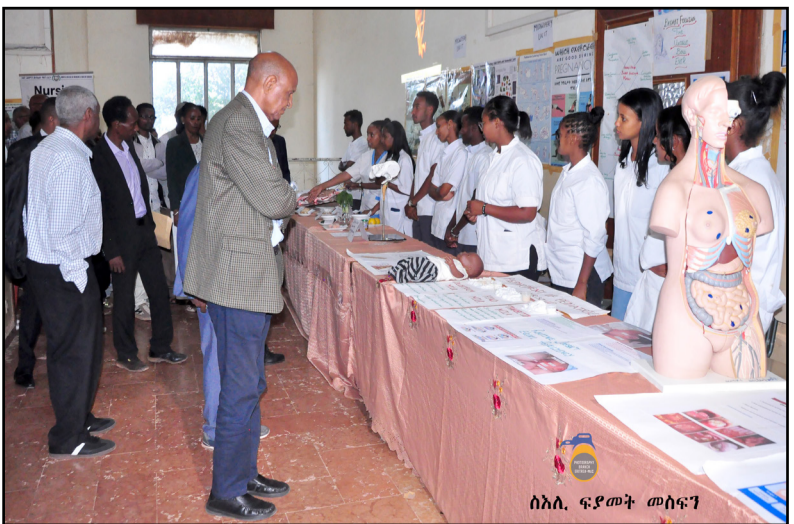
ሰኔ 14፡ ፍ.ደ.መ.ት መስፍን

መዘገብ ስነ-ሰርዓት መዘገብ 13 ዓመታዊ ፈሰቲኻል ኮለጅ ሕክምናን ስነ-ፍልጠት ጥዕናን ኣሮታ፡ ብ12 ሰኔ ኣብ ኣሰመራ - ቀጽሪቲ ኮለጅ ተኻየዱ። እቲ ፈሰቲኻል፡ ብመልክዕ ውድድር ንሸድሻት ኣዋርሕ ዝደገጸል - ኣብ ትምህርቲ ባህልን ስፖርትን ዘተኩረ መሰናድኣታት፡ ከምኡውን ምርኣት ቅዲ ኣልባሳትን ገሪጎስ ሕክምናዊ ትምህርትን ዘገጸባርቅዮ ነይሩ። ዲን ናይቲ ኮለጅ ዶ/ር ዮማክ ስዩም ኣብ ዝሞ ቃል፡ እቲ ፈሰቲኻል - ዓቕምን ንቅሓትን ተመሃሮ