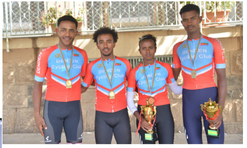
ሰማኢት 2026 ኮይኖ።

ኣትዮ፡ ኣበል ጋንታ ደብብ ሚኒን ሃብተሰላሳ ብተመሃሰ ግዜ ካልኣይቲ ክክለቲ እንኳ 3ል ጋንታ ናርዶስ ጸጋይ ኮኔ ኣርገወት ካልኢት ድሕሪ ንዘመዘገቡ ገጽል ሰነድ ሳልሳይቲ ኣትዮ፡ ብርክቲ ፍህደ - ዓራቄ ርብዕ ብርገን ርምና ገሰሽን ካብ ደንደን ኮኔ ክክለ ባዳሕይ ግዜ ደረጃ ሓዘፍን። በዚ ውጽኢት ብወላደት ግዜ ስወታት ኣብ ማእከል ስድመ (ጅግር) ርብዕ - ደንደን ኣርገወት ግንደንን ራካል ዐቐባይን ካብ ዓራቄ ኣብ ዓባይቲ ደሚ ሰነድ ፍህደን ሚኒን ሃብተሰላሳን ጋንታ ደብብ ኮምፒሊትን ኣድም ሳይት ካብ ቀዳሚይ ክክለ ሳልሳይ ብምውጻዕ ተኸሰሙ። ጋንታ ደብብ ኮኔ ብ15 ሰነት፡ 11 ደቐቕን 23 ካልኢትን ስወትቲ ሞገዲ