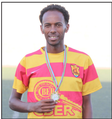
ተጸዋታይ አዳሊሰን - ሳምሶም ተኸሰተ ካብ ኣክራም ኣይምን ኣበል ክክለን ሹቶታት ወሲኻ ብገራክ 5ብ0 ተግደታ። እዚ ጋንታ ነገሩ ናብ 20 ክብ ኣበል ራብዳይ ደረጃኡ ኣውግዶ ኣሎ። ሄርግን ናይቲ ግዮም ብሉጽ

አብቲ ናይ-ብቐድሚት ስምዒት ጸወታውን ንምይ ተመናይ ኣይመካሪታ። አብ ታዳሚ ደቐቕ ካብ ሄርግን ገብረገብረ ብመዘገብታ ሹቶ ናብ ስድናቲ መሪካ ድሕሪ ምውጻዕ ካልኣይ ኣብረ ሓንቲ ደቐቕ ሞሪይ ምስ ተሃሳይ ኮኔ ብርክ ተኸሰሞኸኡ ካልኣይቲ ሹቶ ኣመዘገቡ። ሄርግን ገብረገብረ ንጸሓ ካልኣይቲ ንጋንታሉ ሳልሳይቲ ሹቶ ኣመዘገቡ። ኣገዛዥ ዓብላሊት ኮይኖ ዝመዘገቡ አልታሕሪር አብ መዓል 72ን 90ን ደቐቕ