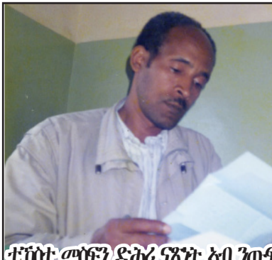
ተገብሩት መጥባኸቲ ድሕሪ ናጽነት ኣብ ንጠፍ ስራሕ

ዝሞተ ልታት ሞራይ እዩ ዝርኢ እምነር ኹ ብወገይ ዘሎ ሰብ ብገምብ ሓሸኹ ክውረሰ ገራም፡ ስጉ ደማ ሰላ፡ ሽው ዝላ ዝረዳ ደክተር ተገብሩት ብከሕ ከይተገብሩ ኮም ዘርገሰ ኮም ኮም ዝገብሩ ብቲ ዝተመገኑ ጎንደራን ደሕምና ደሕምና ሰላዘበሎ ንብርጅ ከይደኽ ክኮበ "ኣሕረስ እዩም፡ ባልፊ መጥባኸቲ ጎንደራን እዩም" ብምባል ኮም ኣይነት ተርጉሞ ገበር ምኵን ገላይ፡ ኹ ተጻይ፡ ደክተር ተገብሩት ግን ኣላርፍ ካብቲ መጥባኸቲ ኣውጻዕኡ፡ "ምስ ከብቲ ኣብ ወተሕጃ ተሰሪኹ እናሰተኽ ደኡ እንታይ ደሊኹ" ብላ ጠነቲ ናይቲም ሓሸኹ ከበርጎ፡ እቲም ሓይም ሰውራ ነቲ ብመውጋቲ ዝተገብሩት መጥባኸቲ