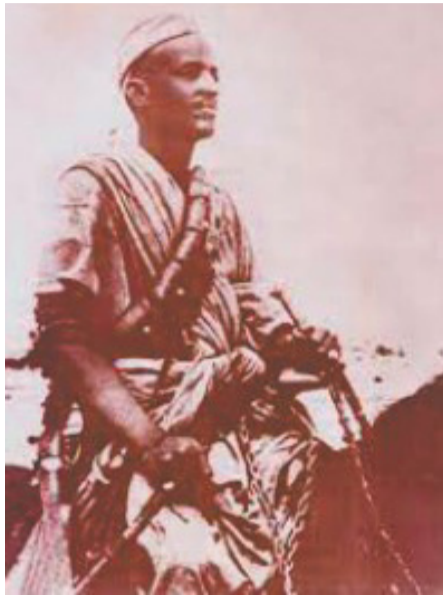
• ኣነ ተሰዋሪ ማለት፡ እዚ ቃልሳይ ሞይት ማለት ኣይነ፡ እንተ ሰሞርኩም ንህኩም ሰውራ ኣይጠፍኡንዮ። ኣላምዶ ክርከሱን ኣይገቡሉ። ወላኳ ኦገና ሃይማኖት እንተ ሃለወና ሃርና ይቐልል።

ሓንዲዮ፡ ከልና ኸኣ ሓደ ኣና፡ ለሚ ሰውራ መርገዮ ዝምቅራ መጻል፡ ግን ክመጽኡዮ።