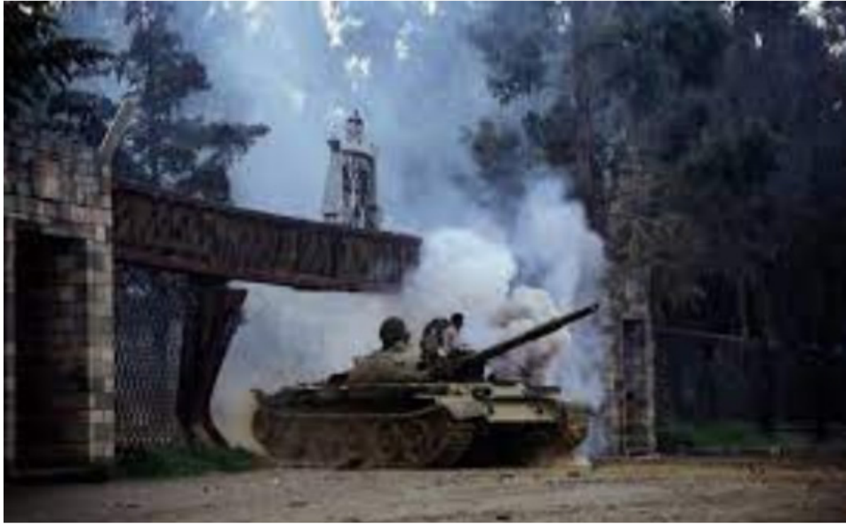
ቤተ መምህራን ኣዳላ ኣብ ገበራ ኣጋር ኣሃዱታትን ታዳጊታትን ደርግ ውጻዕን መጻውዒን ዝኾነ ሓገራት ኣይኮሩን።