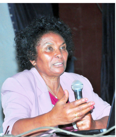
ሃማዲ ኮሚሽን ገለጹ።

ፕረዚደንት ሃማዲ ሚኒስትር ደቂኣንስትዮ ኣርቲብ ወ/ሮ ተኻኢ ተገሰገሱ ንደቂኣንስትዮ ኣባላት ክገልጹ ሚኒስትር ምክልኻል ኣብ “ተራ ኣርቲብ ደቂኣንስትዮ ኣብ መኻንን ልምድን” ዘከተረ ሰሚናር ኣካዱ። ኣብቲ ብ15 ግንቦት ኣብ ኣሳይያሱ - ኣዲስ መዓዘይ ደንብ ዝተገብሩ ሰሚናር ህዝቡ ግዳር ሚኒስትር ብራሕን ተኻኢን ግምገማር ሓይል ናይ ምትሕብርታዊ ምግባራት ስርዓት ኮሚሽን፡ ኮሚሽን ደግ ኣብ ወርኪ ስነ 1979 ኣብ ሓራ መሬት