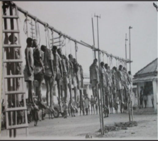
ሰምጺታት ቁጽሕ ኣብ ምሕል ከተማ ከርን ተገጠጠሎም ደረጃ

ክብራት ኣገበቲ፡ ካብቲ ሕጋዊ ዝፍልግ "ሰውራትና ቅርሶትና" ብዘብል ኣርገሰ፡ ብኣጋጣሚ መዘገብ 35 ዓመት ናጽነት ኣሃዱ ኣላ፡ እዚ ደሜ ብዘገለ ቅርሶት ሰውራና ዝበልጽ ኣብ ግዜ ሓርታዊ ተጋደሎ ካብ ዝተሓለ ሰውራት ሰውራ እናመረጸና እንቐርብ፡ ምክንያቱ ሰላ ክንዱ ሰሕን ቃላት ካብ ኩሉ ብከሕ መገለጺ ዘይገልጹ ህደው ምክር ናይቲ ዝተገለጸ ክስት እዩ፡ እዚ ገርጎይ ዘላ ሰላ ኣብ 1960ታት ተጋደላ፡ ተጋደሎ ሓርት ኣርትራ ኣብ ሎሚ ዘገ ግዳር ዝበል ዘሎ ብቲ ናይ ሽው ኣውራጃ ሰነሕቲ፡ ዝተሓሸኹ ዝሓሩ ተጋደላ፡ ብህይወት ሰርጎት ሃይለማርያም ሓይላ ምስ ወረደም ብደግገን እናተገለጹ ዝተሰውሉሎም፡ ሽው እዎን እቲም ተጋደላ፡ ኣብ ኣግራ-ተክሎም ሰብ ዝሓሩ ምስቲ ዓርግሽ ሓይላ ኣሕዋጽ ኣሕዋጽ ክገብሩ ምጥባኸቲ ኣይሰምና፡ ጸላኢ ደሜ ክኮም ዝተሰውሉ ተጋደላ፡ ካብ ልቕደ ዝወደቁሉ ቦታት ኣህቡ፡ ኣብ ከርን ህዘበ ምርጫን ካብቲ ሓዘዎ ዝበረ ሓርታዊ ጉዳይ ንድሕሪት ምምላሽ ብዘበል ክፍእ ማይ ኣብ ጎድኒታት ከርን ኣብ ሓይ ቦታ ኮም ዝገብሩን ክሰፍ ሰባት ብምክባል ምርኣት ኮም ዝሰለጉን ገሎ፡ ህዘበ ከርን ኣውራ ደሜ መገለጻት ነቲ ፍጻሎ ምስ ሰምዑ ኣሸኸቲ ነቲ ብላኣት ዝተገለጸ ገደብ ጀጋን-ኣም ክርኢ ክኮም ተሰቐሎም ዝሓሩ ሰምጺታት ክትኣኡ ናብ ሰውራ ወተዘ፡ በዚ ደሜ ግፍፍታት መጥባኸቲ ገሰጠና ክርድ ይትረፍ ካብቲ ኣብ ባሕቲ መገለጻም 1961 ዝገለጸ ሓርታዊ ጉዳይ ንድሕሪት ክመልሶ ኣይከላከሎ፡ ዝሆዳ እኣ ህዘበ ሓርት ናብ ሓርታዊ ጉዳይ ዓለሎ፡ እቲ ናይ ሽው ብመጥባኸቲ ዝተሰቐሎ ሰውራት ጀጋን ደማ እዚ፡