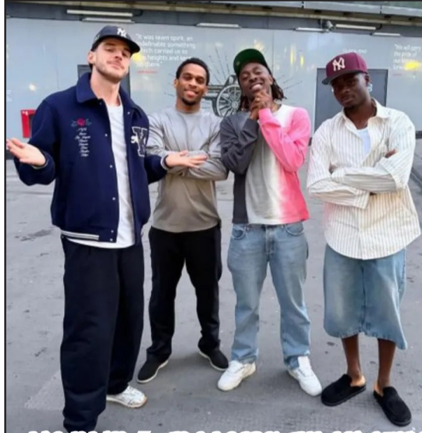
ክትበ ረክብ ሰንበት 5 መጋብታት አብ ጸንቡል ዝበዱ ራይሶ ተምር ኣዘን ሓንቲ ነጽጽ-ወን አብ ከተማ ለንደን ዝበረ ጸንቡል ደገፍቲ

ሰላሰ ምሽት ሲቲ ነዋይ ብምክሳራ አርሰናል ወድደር ክዘዘም ሓንቲ ጸወታ ተራፊዎ እንክሉ፡ ብኣርገወት ነዋይ ብሊጾታ ኣላ። በዚ ደሞ ሰንበት አብ መዘዋዎ ናይቲ ሊግ አብ ሜዳኣ ብክረህታ ፓላስ ተጻጻብ ኣትዩ፡ ዝምዘገበ ወጽኢት ብዘገደሰ ንልዕሊ ክልተ ዕቕድ ዝዘጸበዱ ጸዋኣ ሊግ ከተልዕል እዩ። ን22 ዓመታት ዘንታ ናይቶም ንወቅቲ ምሉእ ከይተሳሎ ሞንጊ ጥሪመር ሊግ 2003-04 ብምልጻል ዘይሰፍ/Invincible ዝብል ቅጽል ናይ ዝተግባዎም ተጻወትቲ አርሰናል ክጽወዩም ሞሪይ ዝሰውዑ ዝበዱ ሓይሳቲ (ድሕሪ 2004