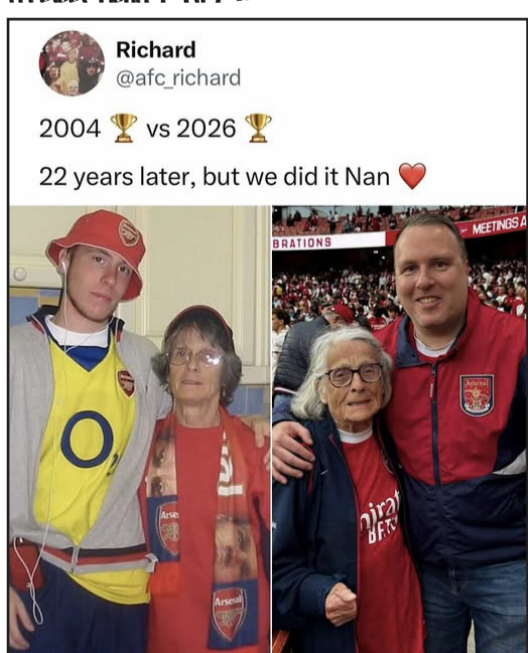
ገላ ክትበን ኣብ ማሕበራዊ መሪኻቢ ዝዘርከብ ኣሳል ኮይና፡ ኣደን ወገን ደገፍቲ አርሰናል ኣብ 2004 ዝተሰልፈዎ ንመወጃታ ግዜ ሞንጊ ምስ ኣልጻሉ ምስታ ኣብ 2026 ዝተሰልፈዎ ኣወዘደም “ድሕሪ 22 ዓመታት ፈጻምኻ” ክብሉ ዝበቐዎ

ዝተወልዱ) ደገፍታ ደሞ ሞንጊ ክትወሰድ ክትወሰድ ክትወሰድ እዩም።