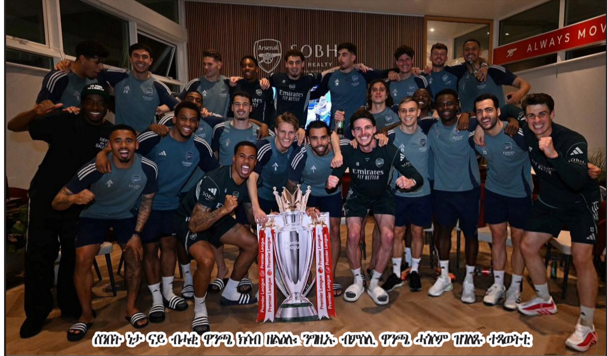
ሰንበት ኮኔ ናይ ብተይ ሞንጊ ክትበ ዘልሉ፡ ንዝኣሉ ብምህሊ ሞንጊ ሓንቲም ዝበዱ ተጻወትቲ

ዝመጽኦ 30 ግንባት ኮኔ ኣብ ፍጻመ ግምገማ ሽምጥን ሊግ ምስ ፒኤሰጂ ግሊ ፍናን ሲቲ ክትኣቲ እዩ። እንተተግዶታ ኮኔ ኣብ ታሪኽ ፋልመይቲ ሽምጥን ሊግ ከተልዕል እዩ።