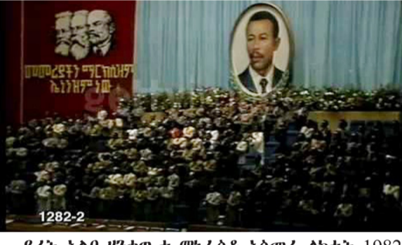
ደረት ኣልቦ ሃንቀውታ ማራፊቶ ኣሰመራ ሰነት 1982

ሰራዊት ሞርድታት ቅድሚት እናተሞላ 7-ሰነት ቀጸለ፡ ኣብ ክብ. ጀግንጊን ኣብ ኣፍደን ሓልቲ ጸገር ዝለ ወግሎ ድሕሪ ምክደይ ኣብ ሓልቲ ባይካ ነይሩ፡ ጸሓፊ ኣብ ቀምሚ ስሙን ወግሎ ሻድሻይ ወራር ብኸሉ ግጥራት ዝበረ ከነታት መካራ ግጥር ሓልቲ ክኣይን ወይ፡ ክ/ቦር-2 ናብ ከረን ተመላሲ፡ ሞም ሓለፍ ከረን ክብኣን ክብ ክቦር 18 ተረሰ፡ ክኸበ መወገታ ክኣይ ስሙን ናይ ወርኪ መጋቢት 1982 ኣብዚ መደብዚ ድሕሪ ምክትላ ንብርጊድ 2 17፡ 34 88 ሓዘት ኣብ ግጥር ናቶ ነዎ ዝበረ ተገይሩ፡ ብርጊድ 31 ኣቆይመን ኣበሊ ምስ ክቦር 24 ናብደ፡ ግጥር ሓላፊ ነይሩ እየ፡ ክቦር-2 እምህር ብኸነዚ ዝለ መሃርኪ ናብ ግጥር ናቶ ኣተወግሞ ምስ ክቦር 18 ብምክት ገገገገል ገገገገል ጸላም ነብ 1826 ግምላኽ ፈተነት መዋቅር፡