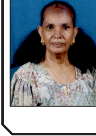
ሰይራብት ሃ/ር መሃን ጸገ