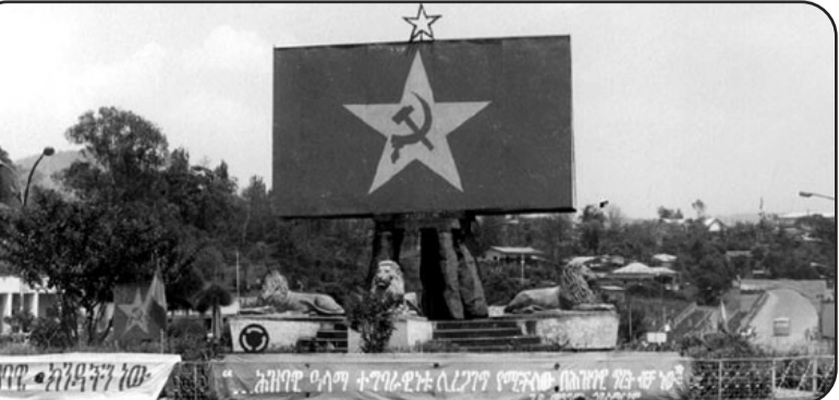
ወራር ቀይሕ ኮንቦን፡ ፍሩይ ሰእልን ፍሩይ ሰዕሪትን!

ጀመሩ፡ እዚ ናደው ምስ ምምጽ ክ/ቦር-2 ሓይ ሓይ ሓይን ዝበሎ ማለት ወግሎ ክከተም ፈተነ ነይሩ፡ ኣብ ዝጠበ ቦታ ጸዕፎ ስራዊት ኣገዳምን ጸዕፎ ተኸነ ስራዊት ብምክት ግምገማ ኣይክላረ፡ ደፋት ተጋደላ፡ ራክጠኸ ምስቶ ሓይ ክብደ፡ ዝፈተኖ ቅዳ እየ፡ ብገብይ ምስ ተራእዮ ግን እዚ ወን ኣይገብራ፡ ባይ ቅዳኪ ኣበሊ ሹዮኡ ክወገዕ ብምክት ኣብ ምእኦ ግጥር መዋቅር ነዎ ዝክፈት ገይሩ ፈተነት ግን ለውጢ ኣይርኸበሩ፡ ክቦር-2 ኣይክት መዋቅር፡ ናብ ጸጋማይ ግምገማ ብሰነት ሓሽፍ ናብ ነብ 2059 ግምድ፡ ብዘር ፈተነትን ኣይተዳወቲ፡ ዝይ ግን ኣብ ክብ. ሰነ 11/3/82 ብኣላዎታት ህሰዝተወሰደ ጸራ መዋቅር፡ እቲ ክቦር ሓሽፍን ኣትፍ፡ ናይ ወግሎ ደክላን ክኸበ ዝፍርከ ገይሩ፡ ኣብ መወገታ ናይዚ ክቦር ኣላዎታት ብተባር ይኸንፍ ብተገልገል ነዎ ዝበረ ደክላኸን ናይ ወግሎ ደክላን ዘይገብሩ ምስ ኣገን እየ ተምገሙ፡