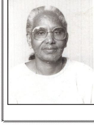
ደቃ ምስ ምሉኣት ስድራቤት