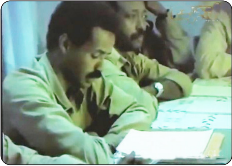
ዝመጽኦ ደምጸኦ ወራሪ ኣብ ባርዕ ሰውራ ሓረር

አብ ዓገጽ 22 ክፍል ናይዚ ኣርእዲክ፡ ክቦር 17 ኣብ ሰነ 15 ብወገን ሳልፊን ኣርወን ኣሳል ወግሎ ብምክት፡ ኣብ ቅድሚኡ ገበሬካ ናይ ሓለፍ መሃር ህዘዎ ግጥር ረገጹ ነዎ ንድሕረ ግጥር ነዎ ዝተለፈ፡ ጸሓፊ ክኸበ ሰነ 17 ኣብ ዝዘገለገለ ወግሎ ናቶ. ግምሓዝ ነዎ መገሪ ዝሕገዎ ኣገዳሲ ቦታታት ነዎ ዝተቐየረ፡ ብወገን ናቶን ኣግራብን ቅልጠፍ ናይ ከነታት ምቕደፎ ምስ ተኸተ፡ ስራዊት ህዘዎ ግጥር ብሰነ 19/2/82 ክብደ፡ ቅድሚት ዝበረ ቀሞሚ መካላሽሲ መሳመሩ ንድሕረት ነዎ ዝተሓለፈ ኣተን ኣብ ሓይል ምክልኻል ዝዘገምዳ ኣላዎታት ደማ ክብ ብርጊድ 77 ኣይ ባሕሪ ደለብ ተደጋጋሚ ጸራ መዋቅር ብምህደር ክብ ኣድ ጸሓፊ ኣገዳሲ ቦታታት ነዎ ብምክት ኣብ ሰነ 25/2/82 እውን ኣብ ክብ. ገይ ስራዊት ብዘረገገ ጸራ መዋቅር ጸሓፊ ክብደ፡ ሓዘዎ ዝበረ ቦታታት ስድፍ ገገገገል ነዎ ዝደረፈ ተመልኪትና ነርና፡ መካላሽራ ናይ እገዳ፡