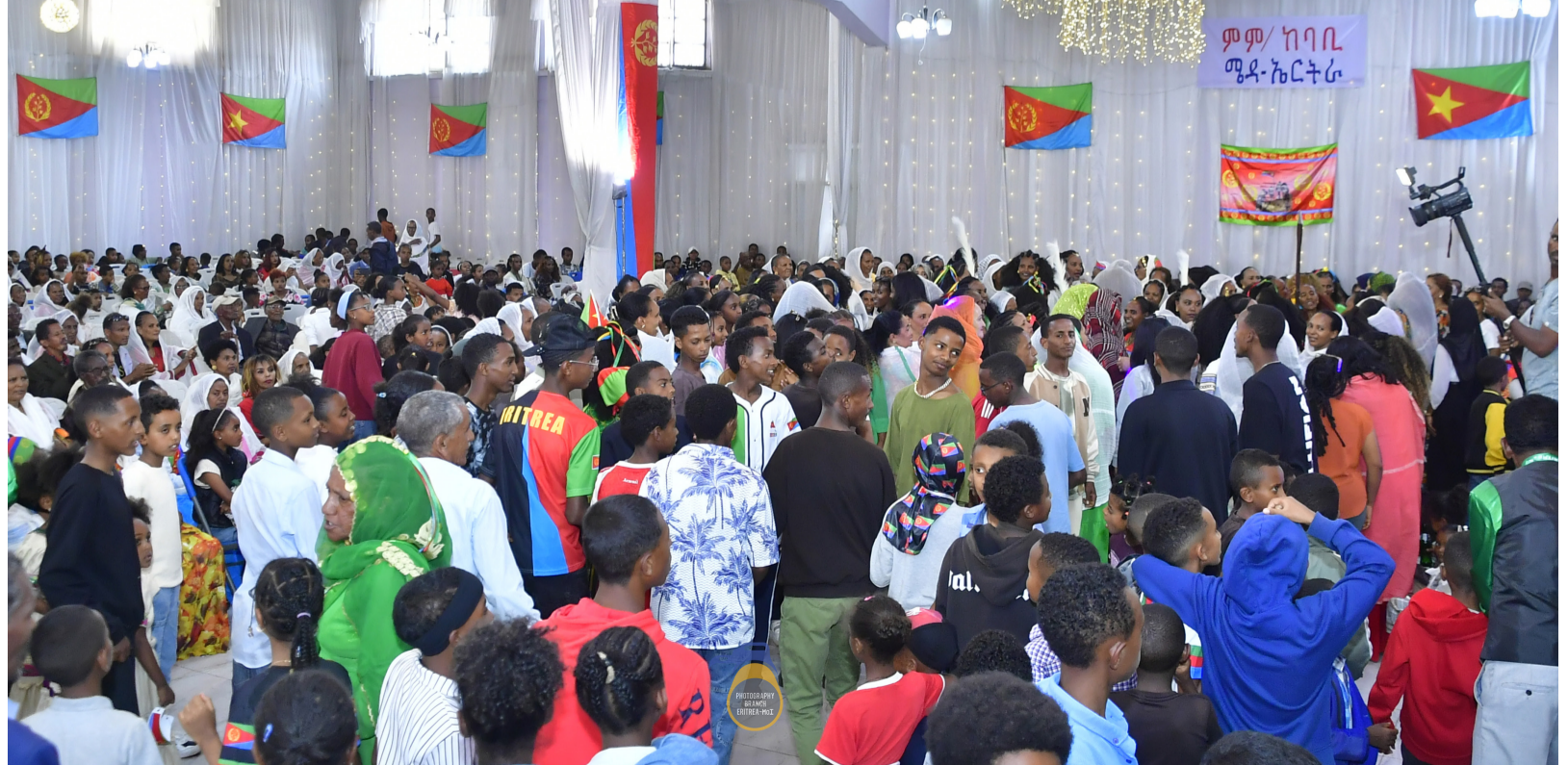
ምም/ከባቢ ሚኒ ስርዓት

ከምዘከሰም እዩ ኣሰለገና። ነታ ብዘኸኸ ዋጋ ተኸፈለላ ዝመጸት ናጽነት ንምዕቃባ ክጸርከ ከምዘለና ከኣ ተሳታፊ።