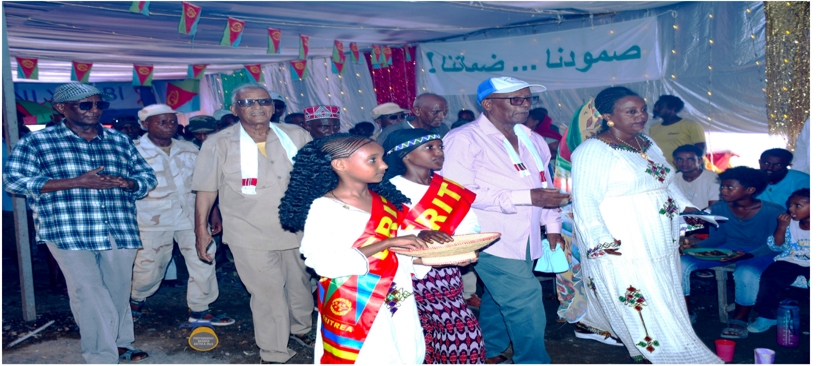
ኮም ህዘብ ክብሪትን ኣርባትን ዘገገገሉ ኮምዘገባ ብሚሆኑ ናይ ለሚ ዓመት ጽንብል ኣብ ዝተሰጠ መድረኽ ደቡብ ምህላው ድርብ ኣገዛዝ ኣዘገብ ኮምዘገባ ኣብዉ።