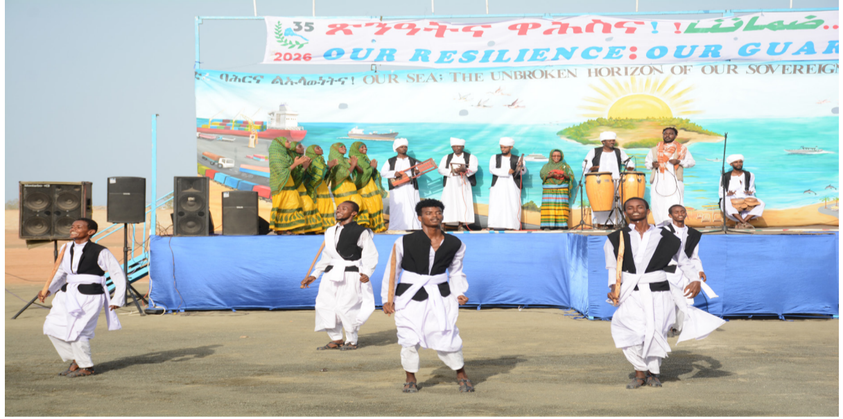
ሰልፊ ኣብላት ሓይሊ ኣየር ሓይሊ ባሕርን ሓይሊ ምደርገኑ ነምኡ-ውን ብክልኣት ጉጅለ ባህሪ ምመተኡ ንኣሳ

ዘከሰግቶም ዘለዉ ርገኣ ህይወት፡ ወጽኢት ናጽነት ንምምጻእ ዝተኸለሉ ነጻነትን መሪርን ሓርታዊ ተጋድሎ ነም ዝኸነ ዝጠቐሱ እዩም ውሳኔ፡ ርገኣቶ ብዘኸ መሳናድታት