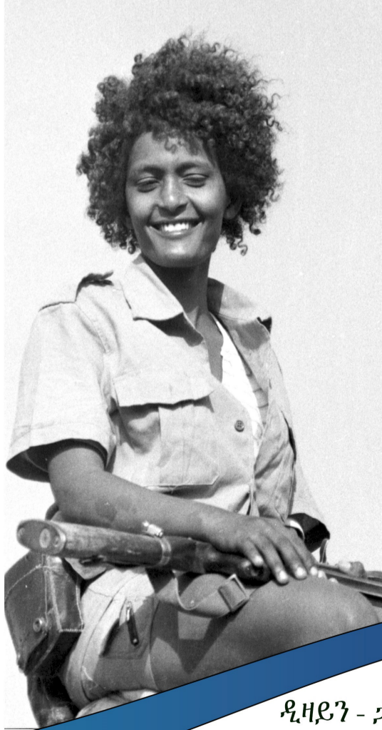
ሰኢሊ- ኣርካይቭ ጨንፈር ሰኢሊ