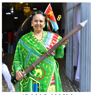
ወ/ሮ ኣሳይር ተሳታፊታት

ናይ ወሓት ወይ ወልቀትት ጥራይ ዘይነሳ ሓፍነት ናይ ከሉ ዘጋ ምዃንውን ኣተሓሳሲ። ካሕሳይ ክሰርከር፡ “ቅንዖት ናጽነት ብምግባር ጸበቅ ኣና ንጽንብሎ ዘለና። ናጽነት ብፍላይ ምና ኣርቲራውያን ፍሉይ ትርጉም እዩ ዘለዎ። ምክንያቱ ብተሓት ቀያሕትን ጸለማትን ከፊልና ኣና ኣምጺእና። የኣና! ንመላእ ህዝብ ኣርቲራ እንቋፅ ናብ መዘገብ 35 ዓመት መጻሕፍቲ ናጽነትና ኣብኸዎና” ክበል ሓገሱ ኣካፈለና።