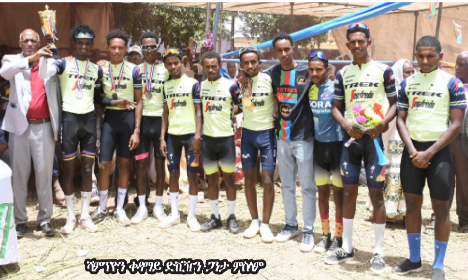
ሻምፕዮን ቀዳማይ ዲቪዥን ፓታ ምግ

ሳልሳይ ዲቪዥን 33 ከሉ ማዕታ ተሰራብም። መካታር ሓሸን ቀዳማይ