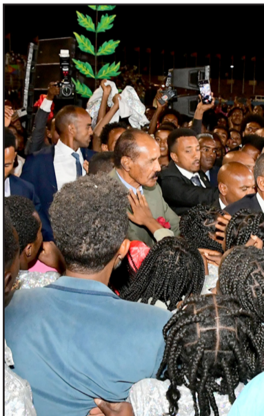
ሕድር ኮሎ ብተሃይራ ተሰንዩ፡ “ኪማ” (ትግራይ) ዘርኢህ ብልጽቲ ደርሬ አቕሪ።

ብድሕሪ ሰልፊታት፡ ስቲ ግብዩ ምርኢት እዩ ቐጸሉ። ደምጻይት ፈራዝ