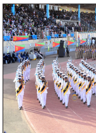
ሓይሊትን ህዘበ ኤርትራ ዘመልከት ነይሩ።

ብመሰረት እቲ ዝወጸኦ መደብ ቀጺሉ ዝቐረበ ወተሃደራዊ ሰልፊ እዩ ነይሩ። ንኣዋሳት ህዘበ ሰራዊት፡ ሓይሊ ባሕሪ ሓይሊ አዩር ኣዋሳት ሃሪቁ ኣገልግሎት፡ ... ብተጨማሪ ንኹሉ ኣባል ሓይሊታት ምክልኻል ዝውክል ስመር ሰልፊ እዩ ተገጸሎ። ስጦም ሰልፊም ጸላምትን