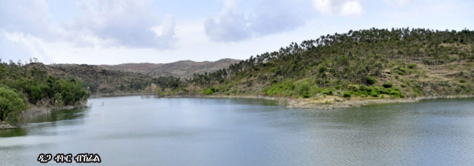
ዲጋ ተኩር ምስል

ሕቶ ማይ ገምገማታትን ገምገማታትን ዝገድድ ዘሎ ወፍራ ብኣብቲ ዘራገድ ደሞ ኣብ ዲጋ ተኩር ዝገድድ ዘሎ ገምገማታት ልምት እዩ።