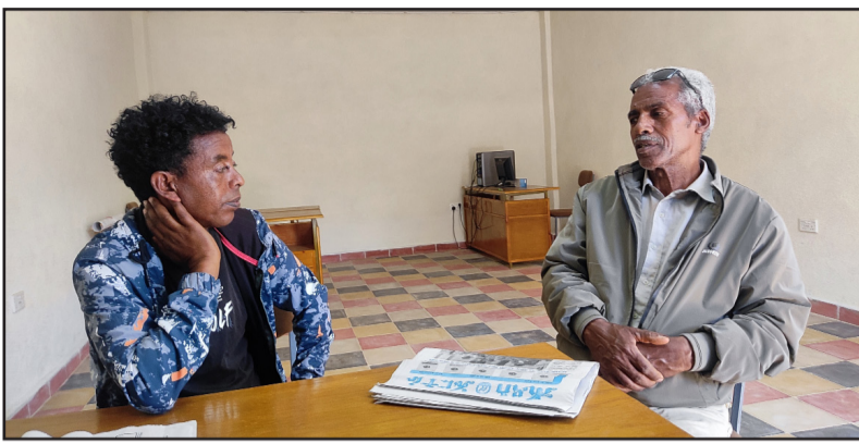
ኣለም ተራሪ ሃይላ (ብጸጋም ዘሎ) ምስ ተጋሃይላ ዓንደ

ወይዘር ለተሰሰን ዝሰሰሰ (ሰይቲ ኣቶ ተኸኢ) መገን ኣጉዳ እንጅራ እናሰጸብት ከላዩ ኣብቲ ዓዲ ናይ ግፍዔ መጥቃቲ ተጀማሩ፡ ዝርገግ ወዳ (ብርኻ ተኸኢ) “ብርኻ ሰጸርኻ ከድ ህይም” ምስ ቤላቲ ኮምኡ ገደሩ