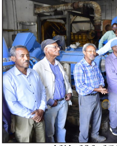
ኣባላት ባይቶ ብምጥታፍታት እናተገልጸሎም

እየም ተካፍቲ ብምቕጻድ ኣባላት ልምት ኣብዚ ሃሊ ዘርክቡ ዘሎ ሃሊቲ ምን ቀላል ነዎ ዘይከሱ ብምህላን፡ ነዎ ጸሓት ኣብ ከሉ ገምገማታት ነዎ ዘሎ ሰራዊት። ንም ኣብ መወጫታ ስገሰ መሪኻትን ጸገብ ህዝብ ብምልላይ ነዎ ቀምጎታት ሰራዊት ገምገማታት ዘሎ ሓርቲታት ልምት ብምክል እዚ ኣብ ዲጋ ተኩር ተኩራ ዘሎ ፕሮጀክት ደሞ ገምገማታት ናይ ማይ ሃብ. ኣሰተገጸኡ ነዎ ዝብሉ ብምክል፡ ንምውጻፍ ነዎ ኣይል መምህር ካብም ዝኸተት ዘበለ ገምገማታት ድሉዮት ነዎ ዘሎ ሓርቲ።