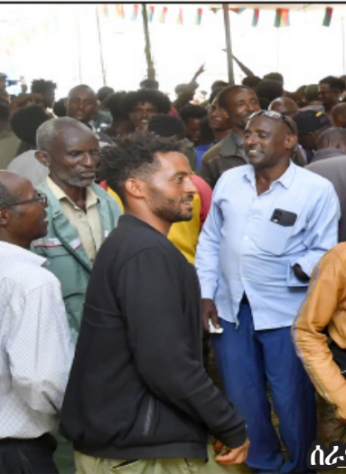
ሰራዊት ልምትን ኣባላት ባይቶን ኣብ ምዘንጋጅ

ኣራመገር ባይቶ ዞን ማእከል መምህር ኣብርሃም ሰሚ ብዘይኡ ኣብ ዘገመዎ ቃል መምህር፡ ሰራዊት ህዝብ ገምገማታት ተገብሮ ማእከላዊ ናትኡ ገምገማታት ብጽግነት ደርሲክ ምህላን ብምህላን፡ ኣብ ምስታብ ማይን ሓመድን መሪኻት ብምዘር ዝኾነ ማይ ህዝብን ሞርትን ገምገማታት ኣብ ዝተኸደደ ጸጋ ቀረብ ማይ ኣብ ገብራት 90 ሚሊዮን ክገደብ ነዎ ዝኾነ ኣብዚ።