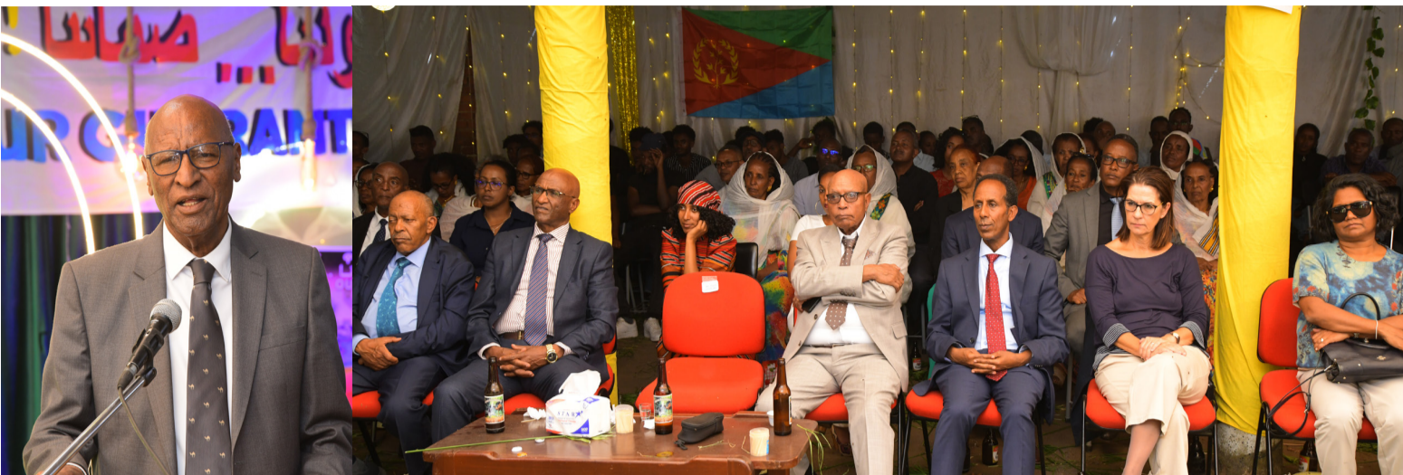
ሚኒስትር ኣረፋይነ በርሀ

ሚኒስትሪ ሕርሻ፡ ንዚ ኣብ ትሕቲ "ጽንዓትና ዋሕስና!" ዝብል ቴማ ዝብዓል ዘሎ መዘገብ 35 ዓመት ዕለት ናጽነት፡ ብ21 ግንቦት 2026 ኣብ ገጀራት - ቀጽሪ ማእከላይ ቤት ጽሕፈት ናይቲ ሚኒስትሪ፡ ኩሎም ኣባላት፡ ዕዳማት ኣጋይሽ ከምኡ'ውን ናይ ልምዓት መሻርኽቲ ኣብ ዝተረኽቡሉ ብልዑል ድምቀት ጸንቡሉ።