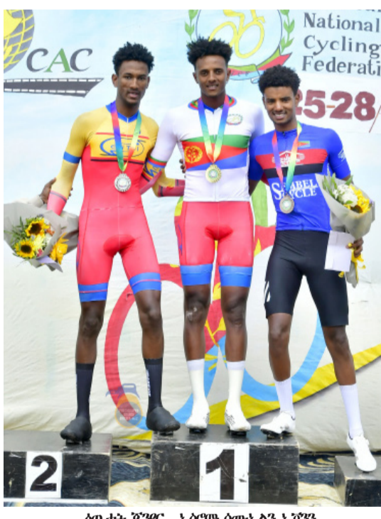
ስጋታት ጅግር - ኣሪም ሞናሊዛን ኣሪታን