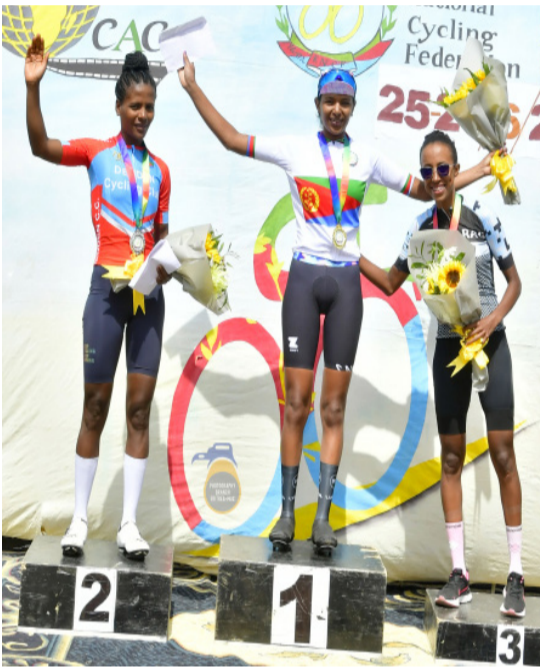
ሞናሊዛ ኣድድምን ብርኸትን ናይ ዓበይቲ ስጋታት