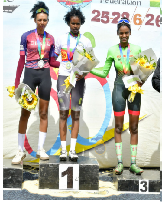
ርዚና ኣድድምን ሰሪታን ናይ ጅግር ስጋታት