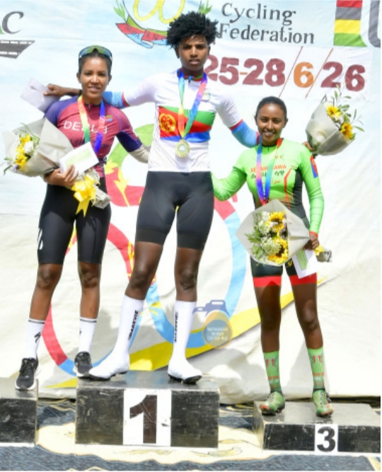
ናይ ጎጃብት 23 ዓመት ስጋታት ሃፍ፡ ማዕቢን ኣርሲማን