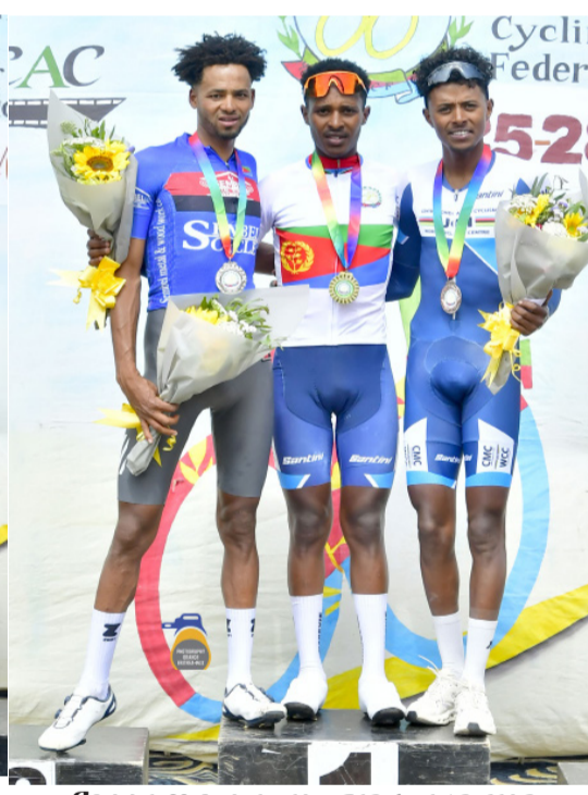
ናይ ጎጃብት 23 ዓመት ስጋታት - ናታን ሞናሊዛን ደረጃን