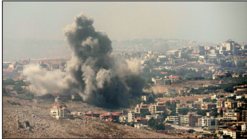
ተወሰኽቲ ሰብ አልቦ ነፍሲ፡ ሕዝባዊ አብ ልዕሊ ሰራዊት እስራኤል መጥቃዕቲ ኮም ዝፈጸሙ ሰብ መዛ. እስራኤል ሓቢሮም።

እስራኤል አብ ደቡባዊ ክፍል ሊባኖስ ዝርቡ ጎርቲ ተወሰኽቲ ሸውዓተ ክተማታት ካብ መረባዎም ነጥብ ኮም ዘለዎም አብ እተጠቓቕሱ ዘሉ እዋን ሰብ አልቦ ነፍሲ፡ ሕዝባዊ አብ ልዕሊ ሰራዊት እስራኤል መጥቃዕቲ ኮም ዝፈጸሙ ሰብ መዛ. እስራኤል ሓቢሮም።